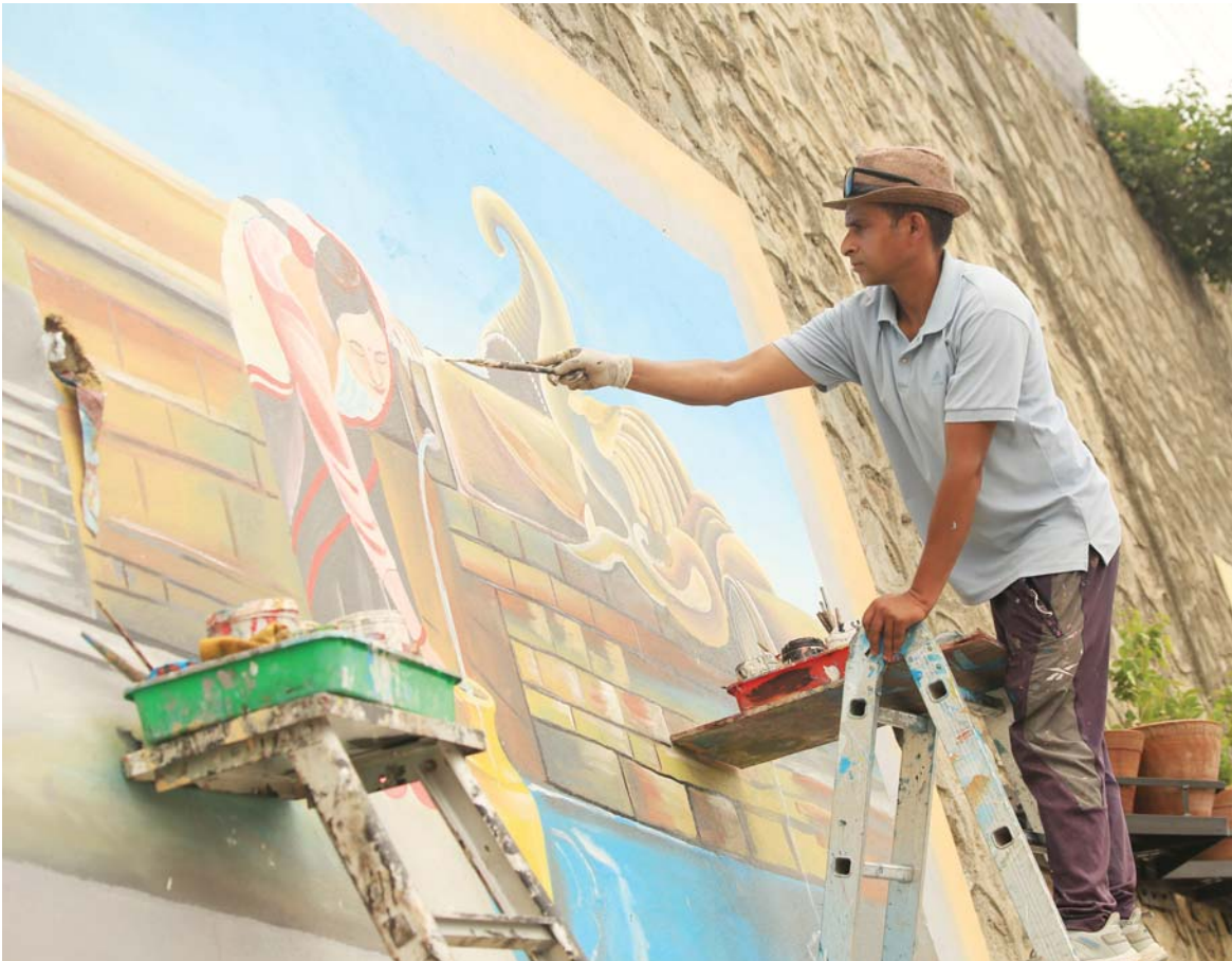
सडकमा गितेचित्र | काठमाडौं महानगरपालिका-३२ अन्तर्गत कोटेश्वर-बालकुमारी सडकखण्डको भित्तामा सम्पादकमन्धी चित्र कोर्दै चित्रकार। काठमाडौं महानगरपालिकाले सडक सौन्दर्यीकरण अभियानअन्तर्गत भित्तेचित्र निर्माणसँगै गमलामा फूल रोपेर सो क्षेत्रलाई थप आकर्षक बनाउने योजनाको कार्यान्वयन गरिरहेको छ।