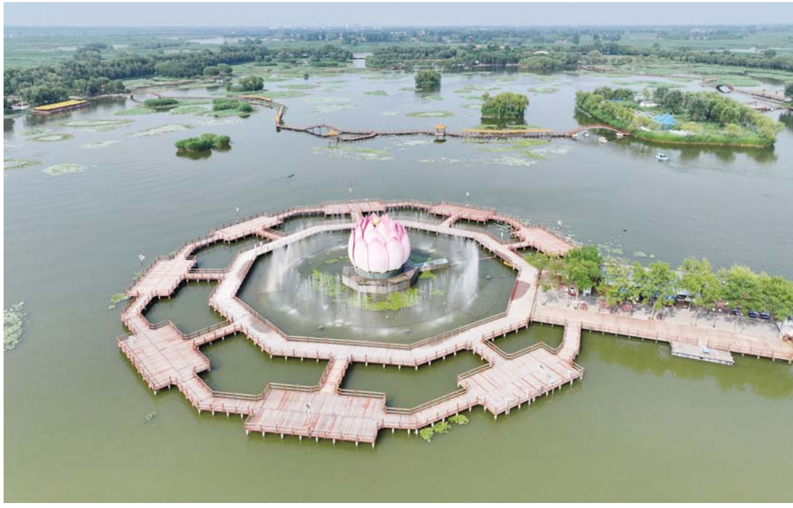
उत्तरी चीनको हेबेई प्रान्तको सियोङआन नयाँ क्षेत्रस्थित बैयाङडियन तालमा रहेको 'लोटस पार्क'को ड्रोनबाट लिइएको दृश्य।