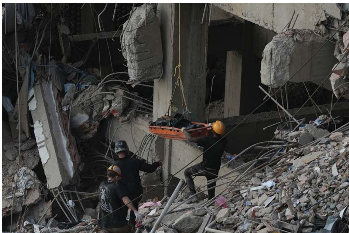
भनेजुलाको ला गुएरामा सोमवार भूकम्पको समयमा भत्किएको भवनबाट एक पीडितको शव निकाल्दै उद्धारकर्मी। गत जुन २४ मा गाएको शक्तिशाली भूकम्पमा परी मृत्यु हुनेको संख्या तीन हजार ५०० नाघिसकेको जनाइएको छ।