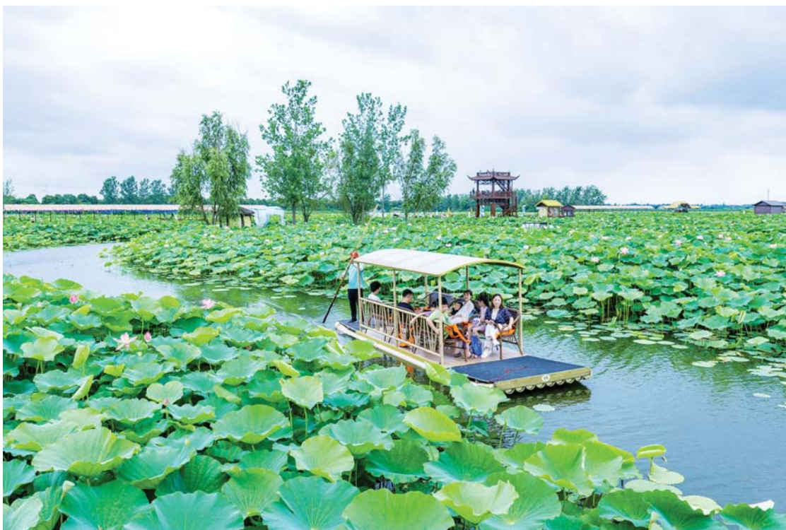
पूर्वी चीनको जियाङ्सु प्रान्तस्थित सिङ्घुआ सहरको एक रमणीय स्थानमा आफ्ना अभिभावकसँग डुंगा चढेर कमलको फूलको आनन्द लिँदै बालबालिका ।