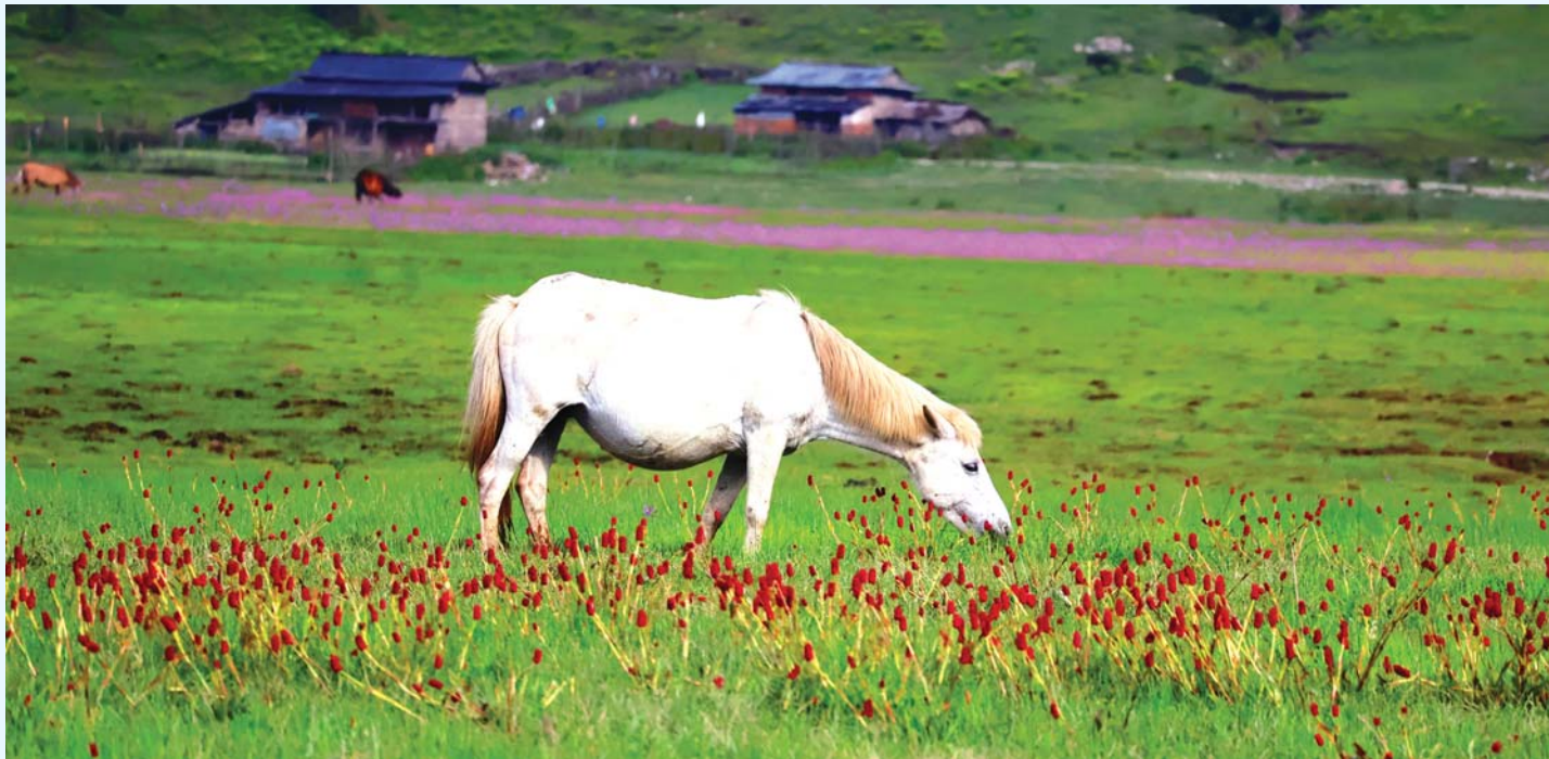
मजगोहक टोरपाटन | बागलुङको टोरपाटन नगरपालिका-९ स्थित टोरपाटन उपत्यकामा फुलेको बुकी फूल र उपत्यकामा चर्दै गरेको घोडा। पछिल्लो समय टोरपाटन लगायत आसपासको मनरम दृश्य अवलोकन गर्न र यहाँ फुलेको बुकी फूल हेर्न पर्यटकको आकर्षण बढ्दो छ।