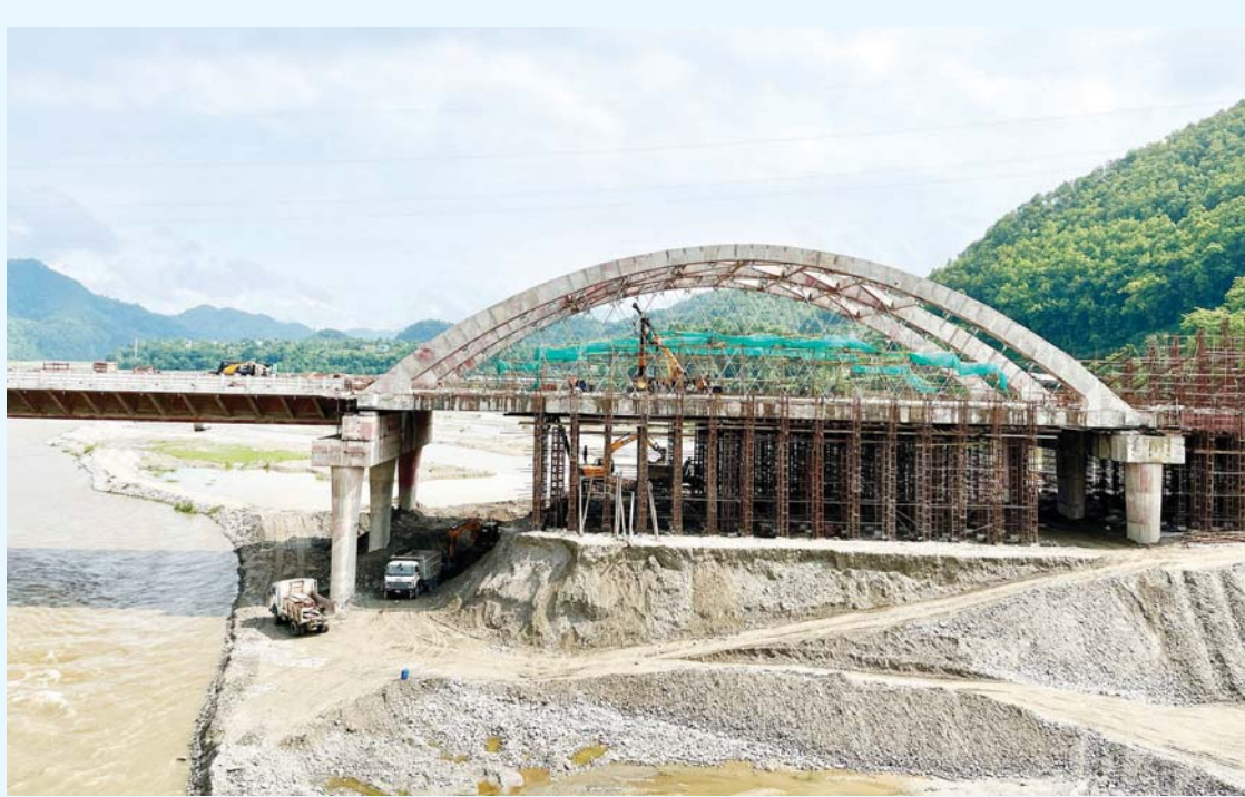
निर्माणधीन | मुग्लिन-पोखरा सडकखण्डअन्तर्गत तनहुँको व्यास नगरपालिका-४ र ५ जोड्ने मादी नदीमाथिको निर्माणधीन 'आर्क ब्रिज'। चार लेनको उक्त पुलमा ८५ प्रतिशत काम सम्पन्न भएको छ।