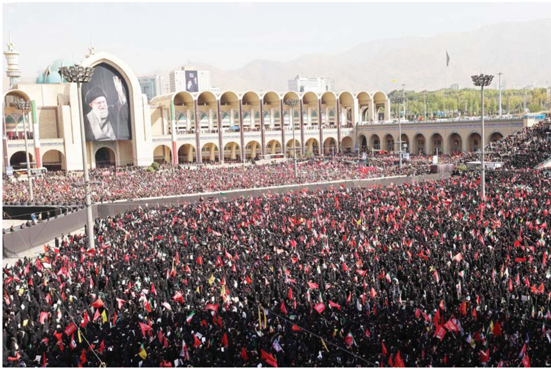
अमेरिकी-इजरायल र इरानबी युद्धको सुरुआती चरणमा अमेरिकी सेनाको आक्रमणमा मारिएका इरानका सर्वोच्च नेता अयातोल्लाह अली खामेनीको अन्त्येष्टि गर्नुअघि शनिवार तेहरानस्थित ग्राण्ड मोसल्लामा आयोजित समारोहमा अन्तिम श्रद्धाञ्जली दिन भेला भएका इरानी जनता ।