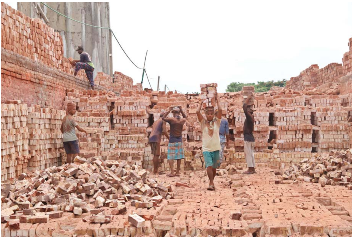
बंगलादेशको मुन्सीगञ्जमा रहेको ईटाभट्टामा ईटा ओसाई कामदार ।