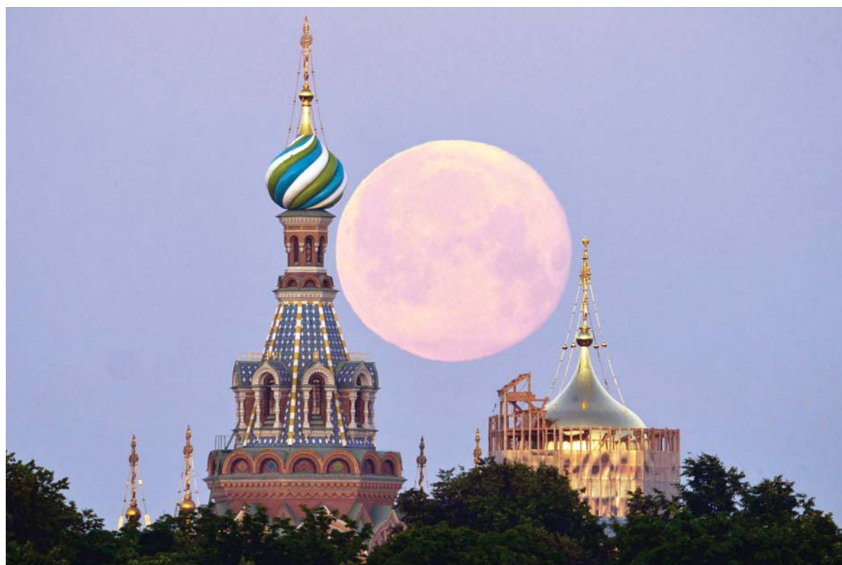
बुधवार बिहान रुसको सेन्ट पिटर्सबर्गमा रहेको बग्ने रागतको मुक्तिदाता क्याथेड्रल पछाडि देखिएको अस्ताउँदो पूर्णिमा।

यही आर्थिक खुलासामा उपराष्ट्रपति जेडी भान्सले पनि सन् २०१६ मा प्रकाशित आफ्नो संस्मरण 'हिलविली एलेगी' बाट १० लाखदेखि ५० लाख डलरसम्म रोयल्टी प्राप्त भएको विवरण सार्वजनिक गरेको छ। रासस/एएफपी