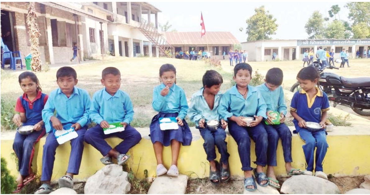
दिवा खाजा खाँदै विद्यार्थी शुक्लाफाँटा नगरपालिका-१२ कालागौडीस्थित शिवशंकर माध्यमिक विद्यालयका विद्यार्थी बिहीबार चौतारीमा बसेर दिवा खाजामा खिर खाँदै। विद्यालयले तालिका अनुसार आधारभूत तहका बालबालिकालाई हरेक दिन फरक-फरक खाजा खुवाउने व्यवस्था गरेको छ।