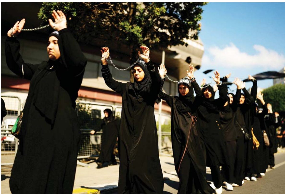
टर्कीको इस्तानबुलमा बिहीबार सातौं शताब्दीमा शहादत भएका इमाम हुनेको सम्झनामा निकालिएको आशीरा न्यालीमा सहभागी शिया धर्मावलम्बीहरू।