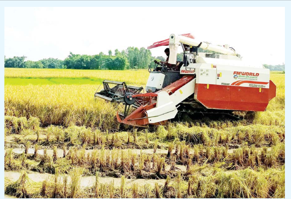
खेतीमा मेसिन मोरङको बेलवारी-९, माभीगाउँस्थित खेतमा आधुनिक मेसिनको प्रयोगबाट धान काट्दै किसान। पछिल्लो समय कृषिमा बढ्दो यान्त्रिकरणको प्रयोगले काम गर्न किसानलाई सहज हुँदै गएको छ।