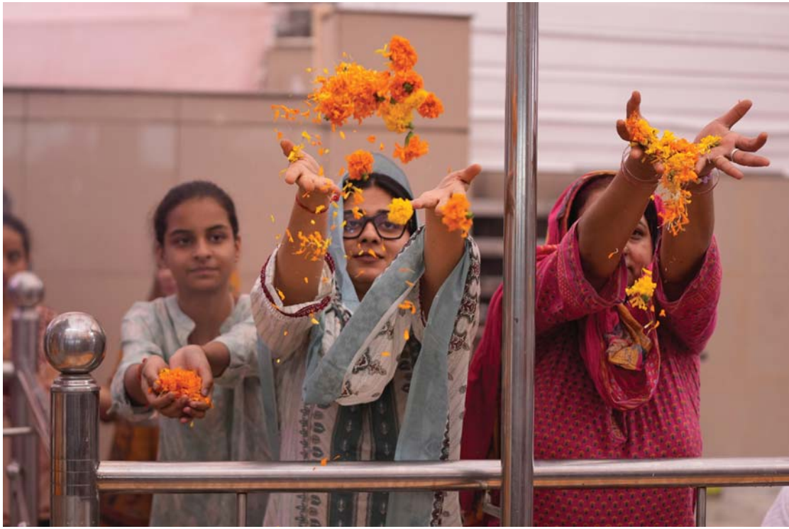
सोमवार भारतको जम्मूस्थित एक मन्दिरमा वार्षिक खीर भवानी मेलामा फूल चढाउँदै कश्मीरी हिन्दू आप्रवासी महिलाहरू।