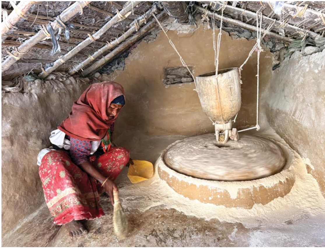
परमपरागत पानीघट्टा | अछामको मेल्लेख गाउँपालिका-२ ऋषिदेहकी महिला पानीघट्टामा पिठो पिस्दै ।