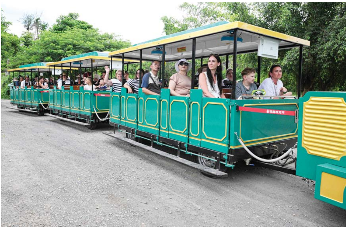
दक्षिण चीनको हाइदान प्रान्तको हाइकोउमा रहेको हाइदान टुपिकल वन्यजन्तु पार्क र बोटानिकल गार्डेनको भ्रमण गर्दै विदेशी पर्यटक ।