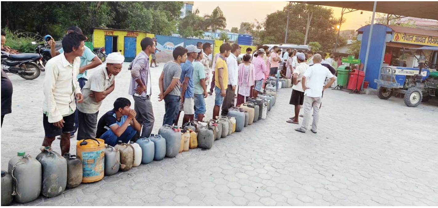
डिजेल लिन लामबद्ध किसान | ट्याक्टरले खेत जोत्नका लागि कैलालीको टीकापुरस्थित पेट्रोल पम्पमा डिजेल लिन लाइनमा बसेका किसान ।