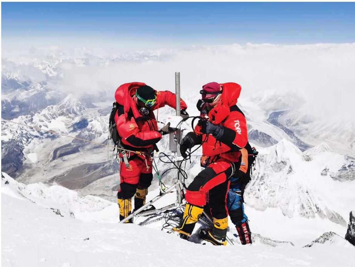
माउण्ट चोमोलोङमा (सगरमाथा)को आठ हजार ८३० मिटर उचाइमा स्वचालित मौसम स्टेशन स्थापना गर्दै चिनिया अनुसन्धानकर्ता।