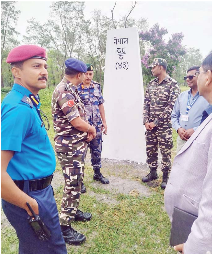
नेपाल-भारत पूर्वी सीमाका जीर्ण तथा भत्किएका सीमा स्तम्भको पुनर्निर्माण र मर्मत कार्य गरिँदै। सशस्त्र प्रहरी बल नेपाल, कोशी प्रदेशस्थित बराह बाहिनी मुख्यालय सुनसरीको नेतृत्वमा भत्काएको भेचीनगर-७ स्थित सतीघाटबाट उक्त अभियानको शुभारम्भ गरिएको छ।