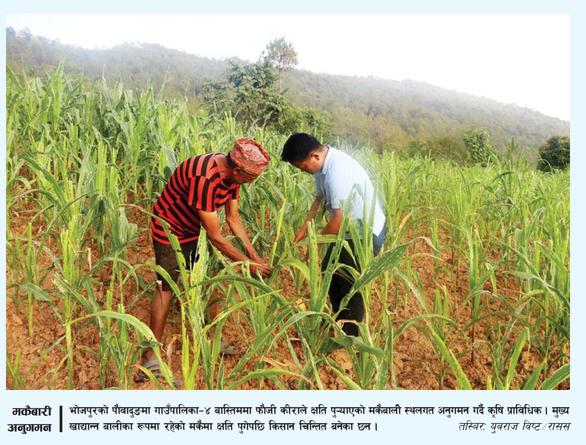
मकैबाडी भोजपुरको पौवादुडमा गाउँपालिका-४ बास्तिममा फौजी कीराले क्षति पुऱ्याएको मकैबाली स्थलगत अनुगमन गर्दै कृषि प्राविधिक। मुख्य अनुगमन खाद्यान्न बालीका रूपमा रहेको मकैमा क्षति पुगेपछि किसान चिन्तित बनेका छन्।