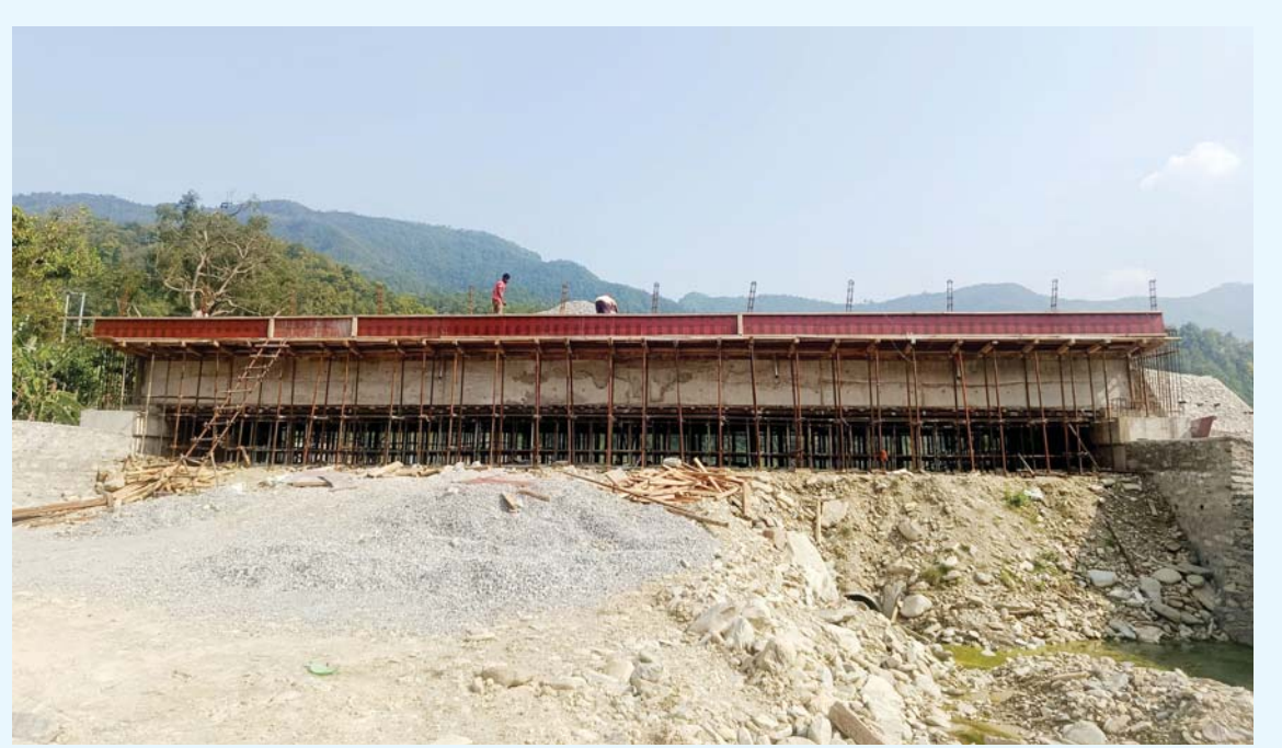
निर्माणधीन पुल | लमजुङको मध्यनेपाल नगरपालिका वडा नं १ र २ जोड्ने खहरे खोलापछि निर्माणधीन पुल।