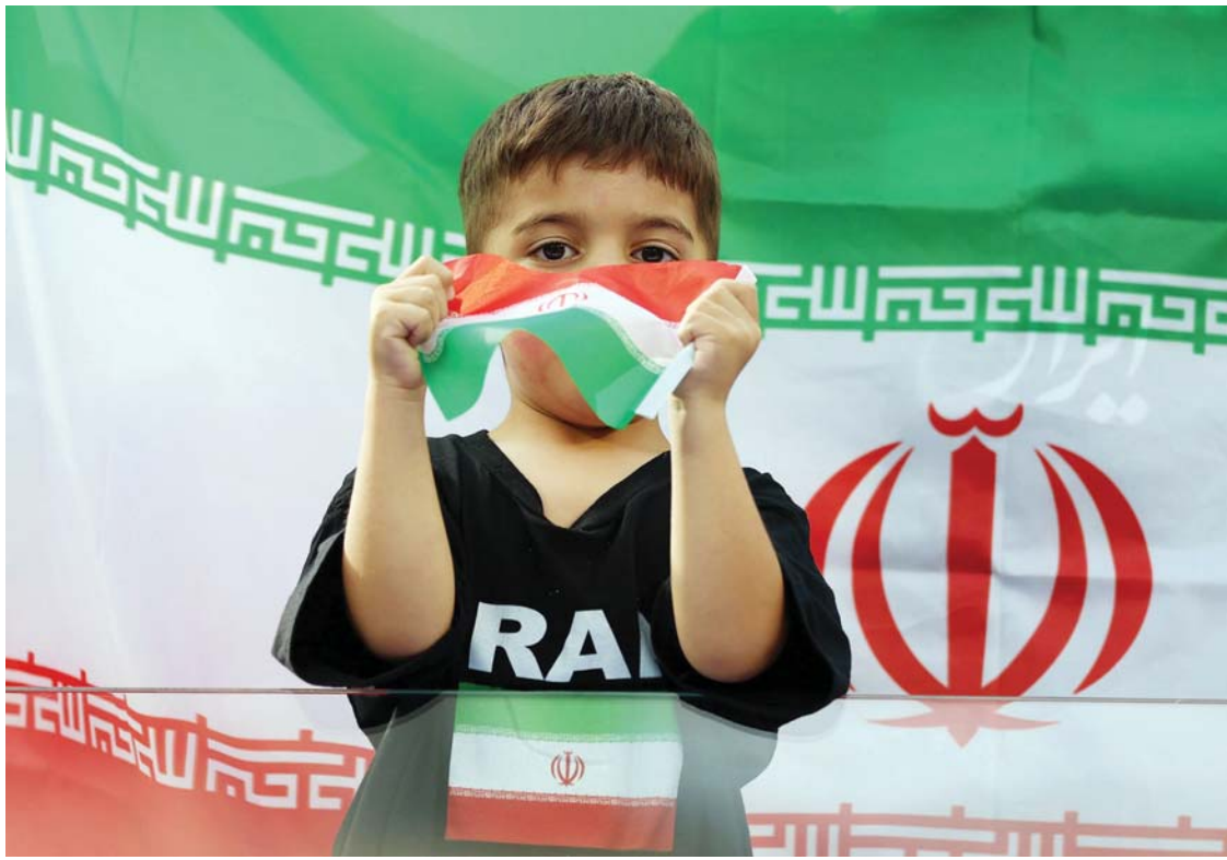
फिफा विश्वकपअन्तर्गत इरान र न्युजिल्याण्डबीचको खेलअघि संयुक्त राज्य अमेरिकाको लस एञ्जलसस्थित लस एञ्जलस रंगशालामा एक इरानी समर्थक।