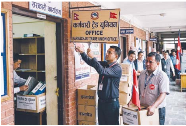
एआईको सहयोगमा तयार पारिएको प्रतीकात्मक तस्वीर