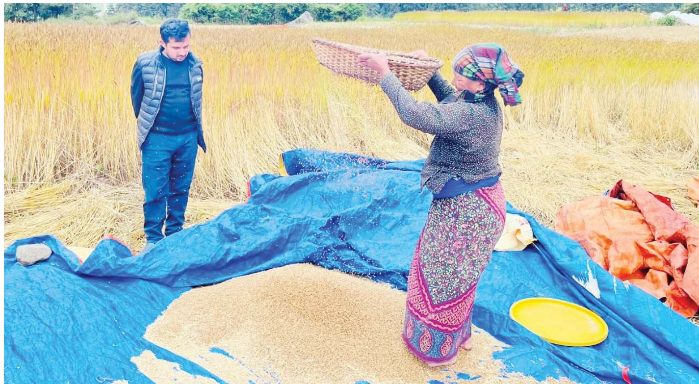
करु सफा गर्दै किसान | मनाङको चामे गाउँपालिका-२ स्थित थानचोकका किसान करु घर लैजान सफा गर्दै । करु मनाङको रैथाने बाली हो ।