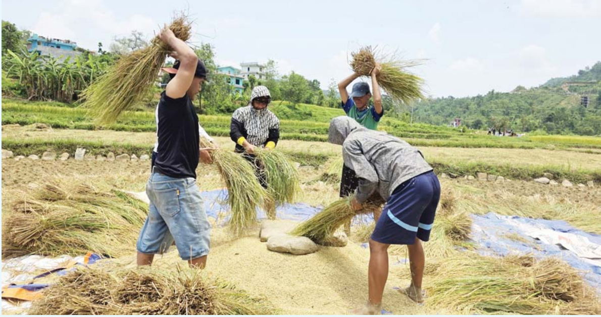
चैते धान त्रिभुवनसिद्ध किसान

तनहुँको व्यास नगरपालिका-११ स्थित घाँसीकुवामा चैते धान भित्रचाउँदै किसान ।