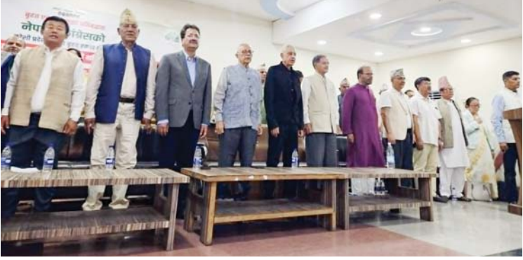
नेपाली कांग्रेसको संस्थापनइतर पक्षले आइतबार विराटनगरमा आयोजना गरेको भेलामा सहभागी नेताहरू ।

हाल पार्टी फुटिसक्यो । यो दुर्भाग्यपूर्ण हो । गगन एकलैले पार्टी चलाउन सक्दैनन् ।