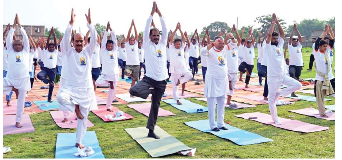
भारतीय महावाणिज्य दूतावासले शनिवार पसाको पचगावा, सखुवा प्रसौनीमा आयोजना गरेको योग कार्यक्रम ।

अन्तर्राष्ट्रिय योग दिवसको मुख्य कार्यक्रम वीरगञ्जस्थित शंकराचार्य जेटमा हुने