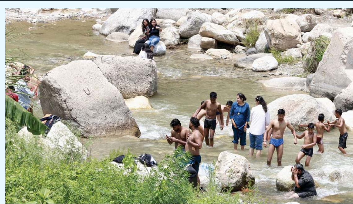
गर्मी छल्ला नेपालतिर... हेटौडा-काठमाडौं सडकखण्डअन्तर्गत मकवानपुरको भैंसेस्थित तीनखण्डेमा रहेको राप्ती खोलाका गर्मीयाममा भारतीय पर्यटकहरूको चहलपहल। पछिल्ला दिनमा गर्मी छल्ला भारतबाट नेपाल आउने पर्यटकहरू बढ्दो क्रममा छन्।