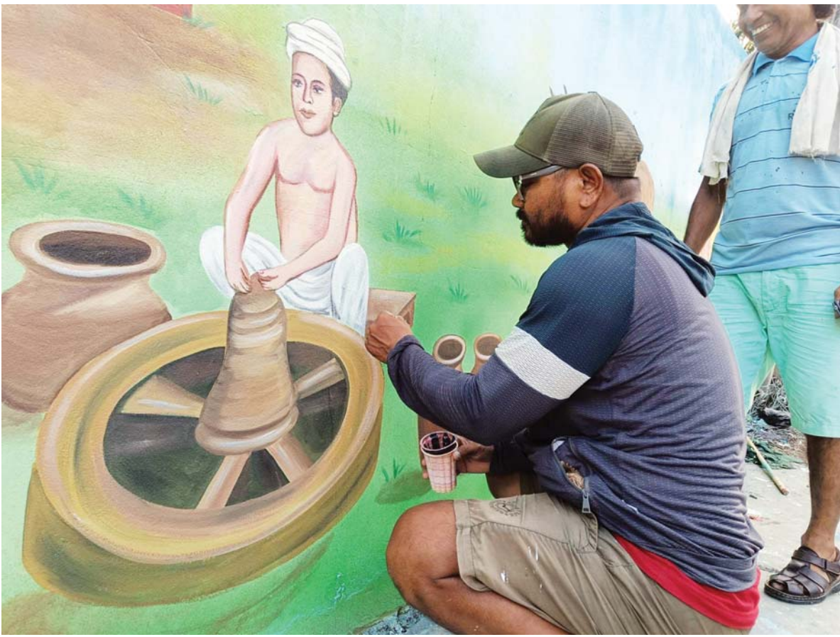
भित्तिचित्र कोर्दा नेपालगञ्जका सरकारी तथा सार्वजनिक स्थलका पखालमा भित्तिचित्र बनाउँदै कलाकार । नेपालगञ्ज उपमहानगरपालिकाको कलाकार सहरको कला, संस्कृति र परम्परा फल्किने गरी सुन्दरता बढाउन भित्तिचित्र अभियान सञ्चालन गरेको छ ।