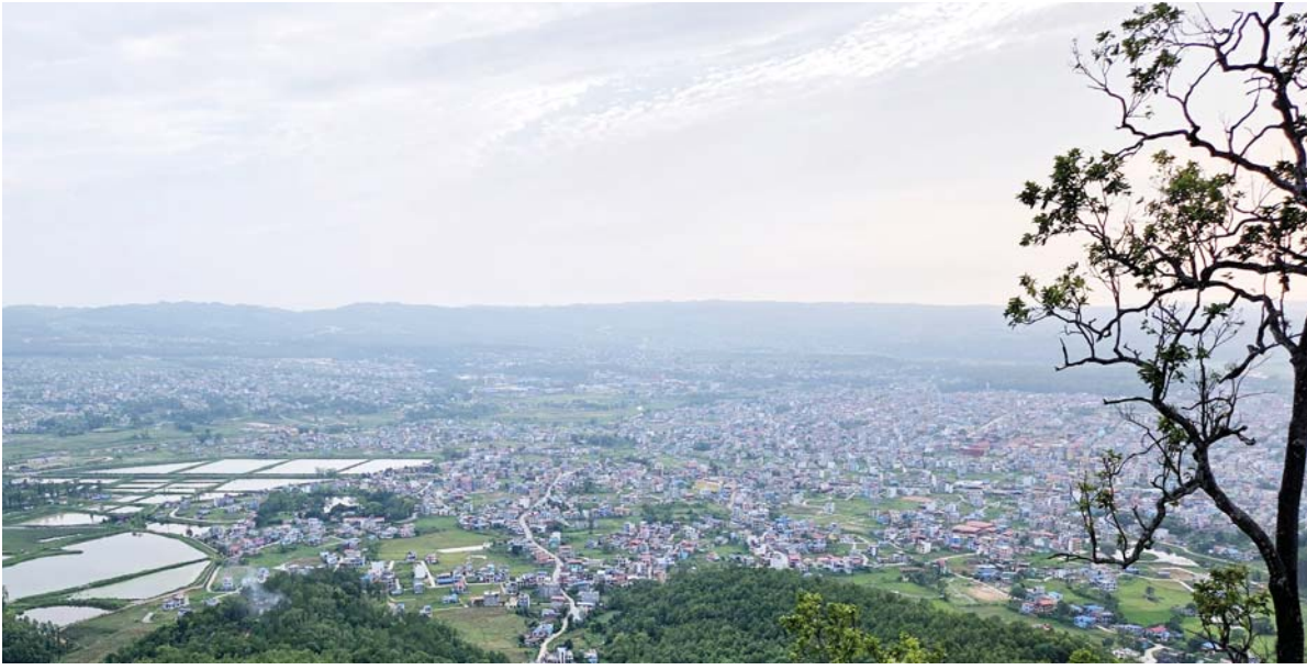
हेटौंडा र मकवानपुर जिल्लाको मकवानपुरगढी गाउँपालिका-४ स्थित मनकामना क्षेत्रबाट देखिएको हेटौंडा र आसपासको दृश्य ।