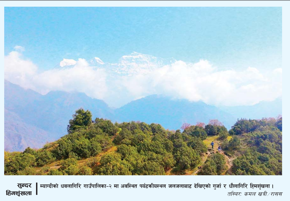
सुन्दर हिमशृङ्खला | म्याग्दीको धवलागिरि गाउँपालिका-२ मा अवस्थित पर्यटकीयस्थल जलजलाबाट देखिएको गुर्जा र धौलागिरि हिमशृङ्खला।