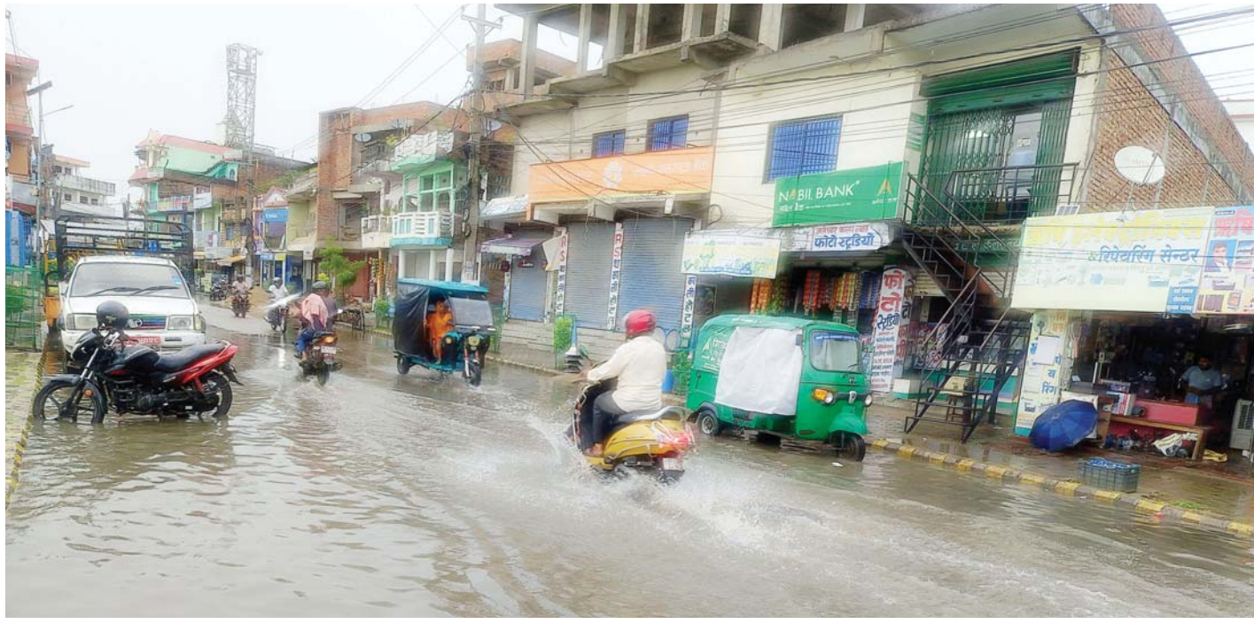
जलमग्न सडक | महोत्तरीको सदरमुकाम जलेश्वर नगरपालिका वडा नं २, महेन्द्रचोकस्थित सडकमा परेको पानी जमेर जलमग्न भएको अवस्था। पानी जाने निकास नभएको कारण सडकमा पानी जमेको हो।