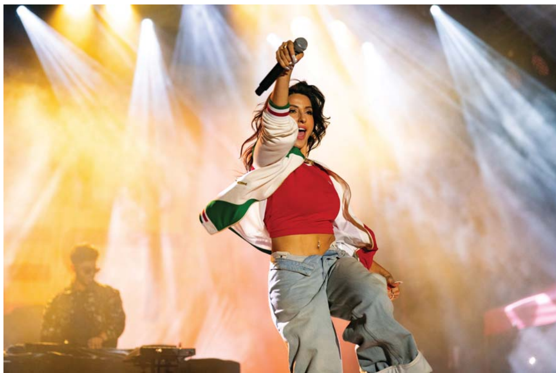
विश्वकप फुटबल प्रतियोगिता उद्घाटनअघि बुधवार टोरन्टोमा आयोजित काउण्टडाउन कन्सर्टमा प्रस्तुति दिँदै नोरा फतेही।