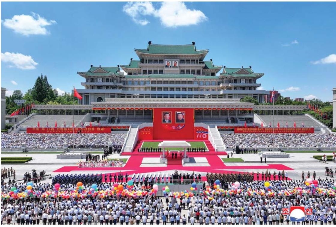
चिनियाँ राष्ट्रपति सी चिनफिङको स्वागतमा सोमबार उत्तर कोरियाको राजनीमा प्योङयाङमा आयोजना गरिएको विशाल समारोह।