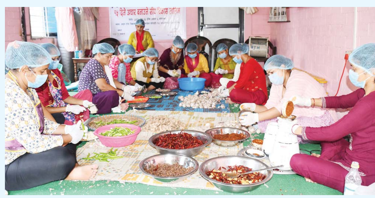
अचार तालिम | दाङको घोराही-१५मा सञ्चालित १५ दिने अचार बनाउने सीप विकास तालिममा सहभागी अपांगता भएका महिलाहरू। तालिम प्राप्त गरिसकेपछि शारीरिक रूपमा फरक क्षमता भएका व्यक्तिहरूले पनि आर्थिक उपाजन गर्ने विश्वास लिइएको छ।