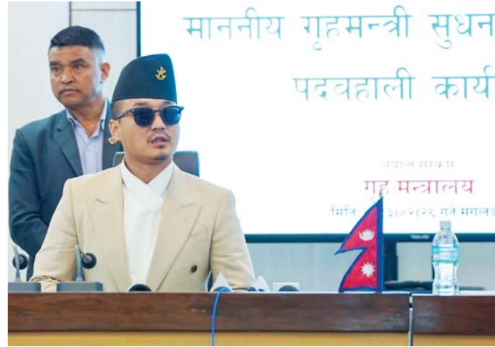
माननीय गृहमन्त्री सुधन पदबहाली कार्य