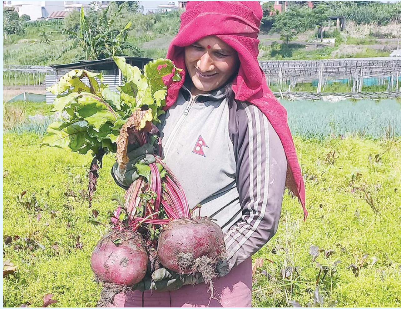
सप्रेको चुकन्दर मध्यपुर थिमि नगरपालिका निकोशोरामा आफूले उत्पादन गरेको चुकन्दर देखाउँदै एक किसान। उनको खेतमा डेढ किलोसम्मको चुकन्दर फलेको भएको छ।