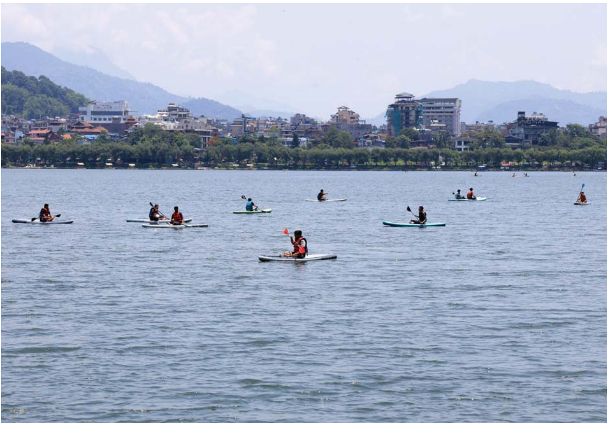
बोटिङमा रमाउँदै पछिल्लो समय बढ्दो गर्मीसँगै पर्यटकहरू विशेषगरी युवायुवतीहरूमाफ कायाकिङ् र स्टाण्ड अप प्याडल बोटिङमा रमाउँदै । युवा पुस्ता