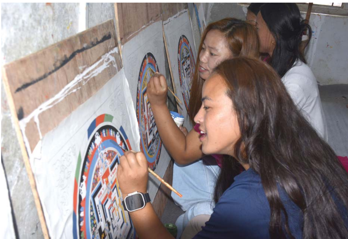
शांका लेखन सिव्दै काभ्रेपलाञ्चोकको डाँडापारिस्थित खानीखोलाका युवाहरू थांका लेखन सिव्दै। युवाहरूलाई आत्मनिर्भर र व्यावसायिक बनाउने उद्देश्यले उद्योग तथा वाणिज्य कार्यालय धुलिखेल बागमती प्रदेशको आयोजना तथा खानीखोला गाउँपालिकाको समन्वयमा यहाँका १७ जना युवालाई एक महिनासम्मको तालिम दिइएको हो।