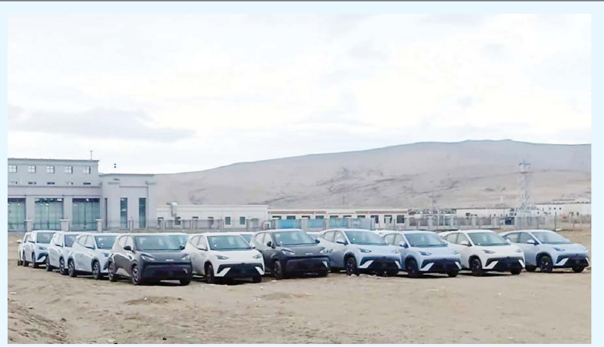
भित्रीयाईदे विद्युतीय गाडी | नेपाल-चीन उत्तरी कोरलाकास्थित खुल्ला ठाउँमा पार्किङ गरी राखिएका विद्युतीय गाडी। चीनबाट नेपाल भित्र्याइएको ६१४ वटा गाडीको नाकामा भन्सार जाँचपास गरिएको छ।