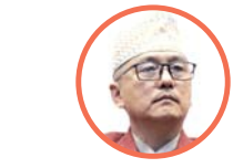
पार्टीका सबै समस्या समाधान गर्ने माध्यम महाधिवेशन हो। ■ राजेन्द्र लिङ्देन अध्यक्ष, राप्रपा