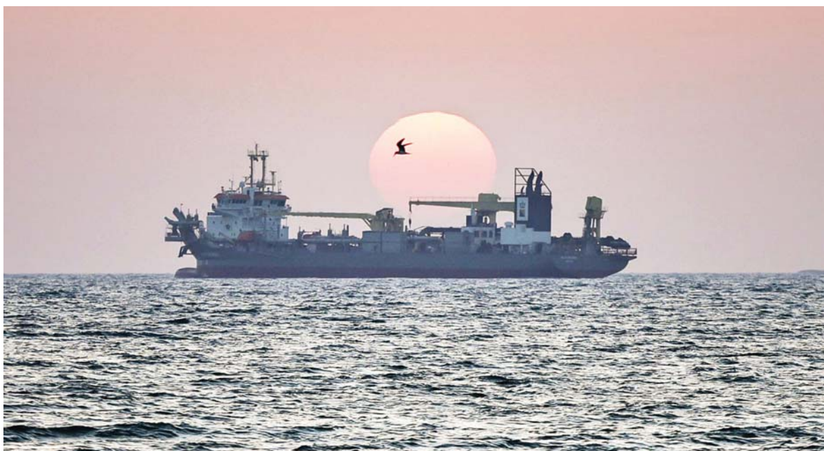
दुबईको तटमा रहेको एउटा जहाजमाथि अस्ताउँदो सूर्य।