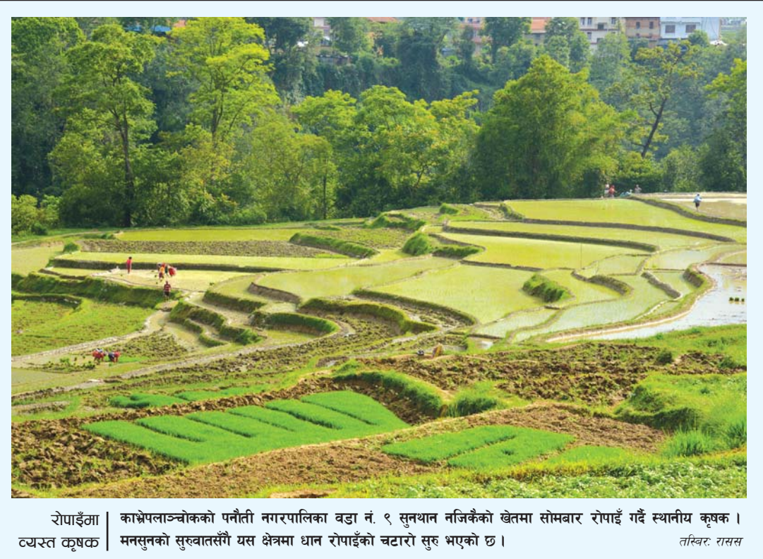
रोपाइँमा काभ्रेपलाञ्चोकको पनौती नगरपालिका वडा नं. ९ सुनथान नजिकैको खेतमा सोमबार रोपाइँ गर्दै स्थानीय कृषक । त्यस्त कृषक मनसुनको सुरुवातसँगै यस क्षेत्रमा धान रोपाइँको चटारो सुरु भएको छ ।