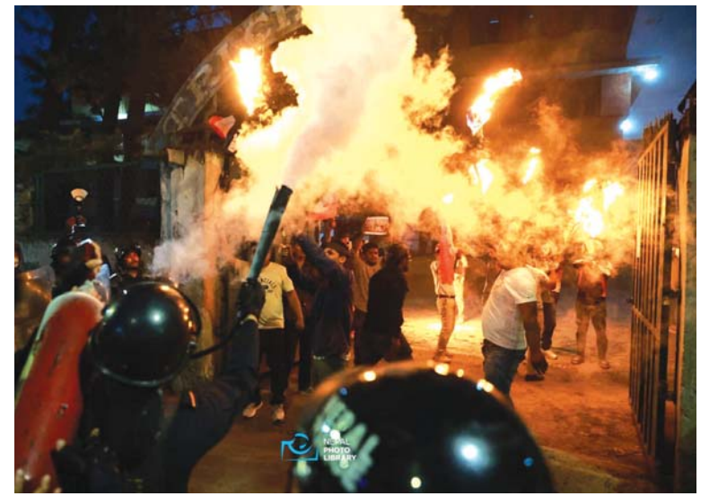
प्रधानमन्त्रीको राजीनामा मागसहित सोमबार साँझ तरुण दलले त्रिचन्द्र क्याम्पसमा गरेको पुस्ता दहन ।