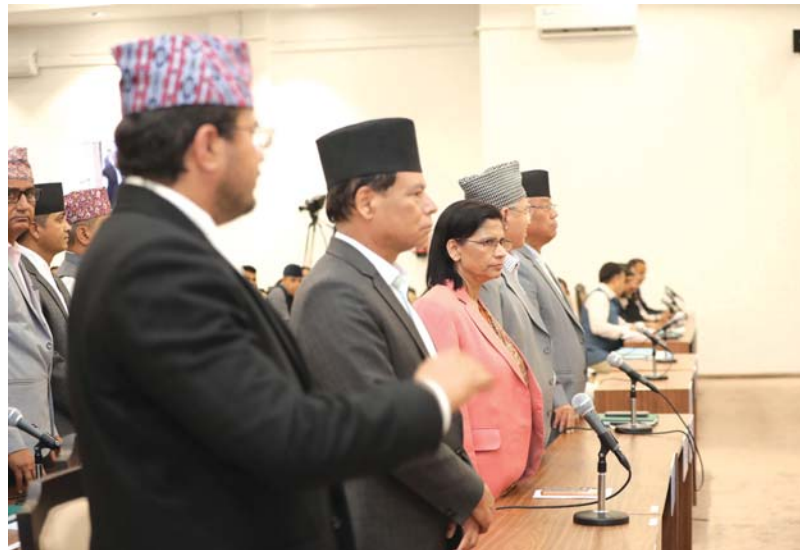
प्रधानमन्त्रीले संसद्मा आएर माफी माग्नुपर्ने माग गर्दै सोमबारको प्रतिनिधिसभा बैठकमा विपक्षी दलका सांसदहरू ।