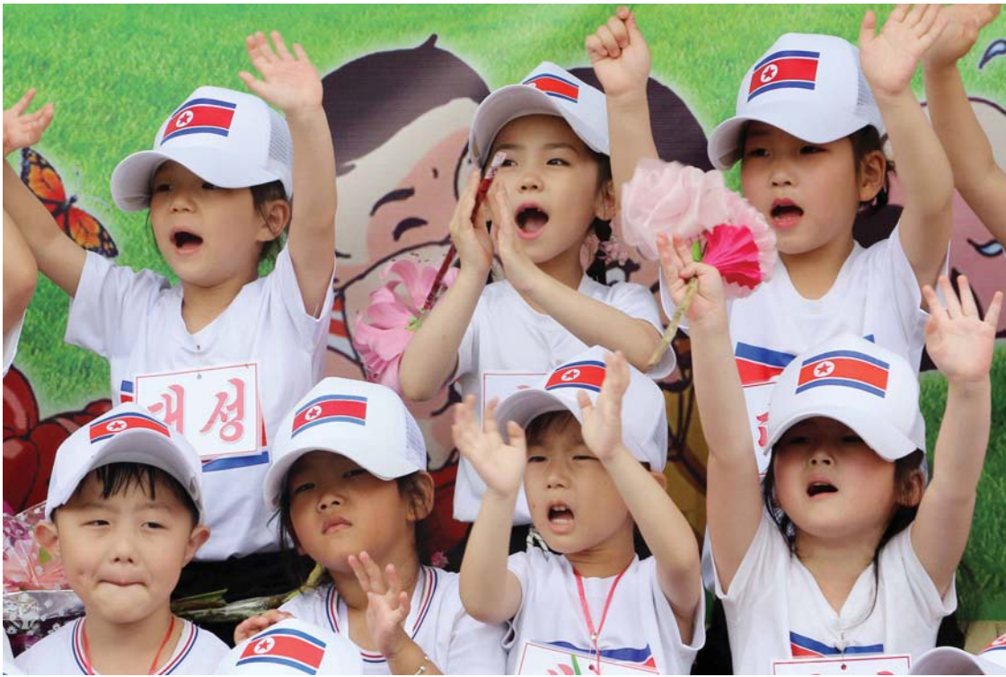
उत्तर कोरियाको प्योङयाङस्थित ताइसोडसान प्लेजर पार्कमा सोमबार अन्तर्राष्ट्रिय बाल दिवसको ७६औं वार्षिकोत्सवमा भाग लिँदै बालबालिका ।