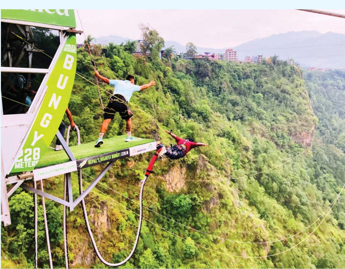
बागलुङ र पर्वत जिल्ला जोड्ने गरी कालीगण्डकी नदीको खोचमा निर्माण गरिएको साहसिक खेल बञ्जीजम्प गैँ आन्तरिक पर्यटक ।