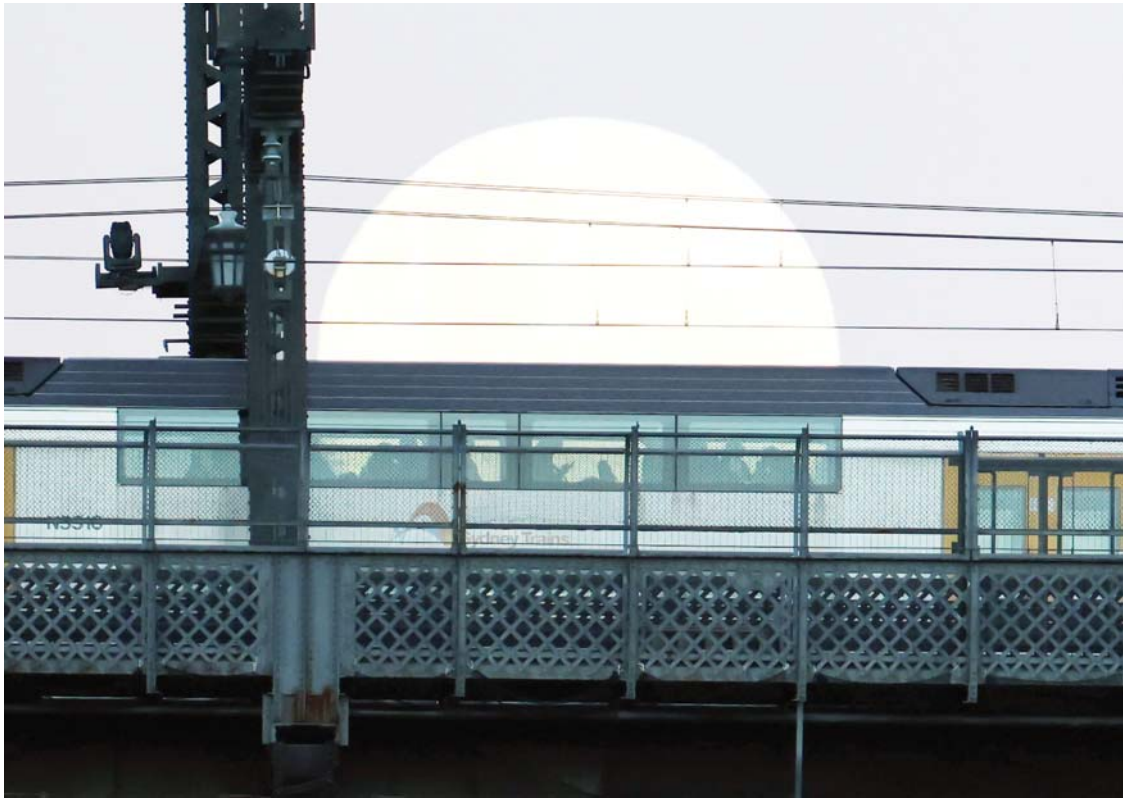
अस्ट्रेलियाको सिड्नीमा आइतबार देखिएको 'ब्लू मुन' अर्थात् पूर्णाकारको चन्द्रमा ।