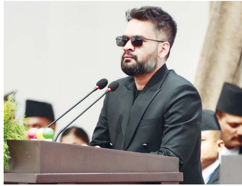
आइतबार प्रतिनिधिसभा बैठकमा सांसदहरूले राखेको प्रश्नको जवाफ दिँदै प्रधानमन्त्री बालेन्द्र शाह।

यस प्रश्नमा प्रधानमन्त्री शाहले लिपुलेक र लिम्पियाधुराको विषयमा बेलायतसमेत सरोकारवाला भएको बताए। 'जवाफमा दुवै देशले इतिहासविद् र सर्भेयर राखेर टेबल टक गर्ने कुरा भएको छ। यस सम्बन्धमा हामीले भारत र चीनमात्र नभएर बेलायत सरकारसँग पनि कुरा गरेका छौं। ब्रिटिस इण्डिया छाड्दाखेरिको बेलायतले पनि सरोकार राख्नुपर्छ। यो सबै टेबल टक गरेर