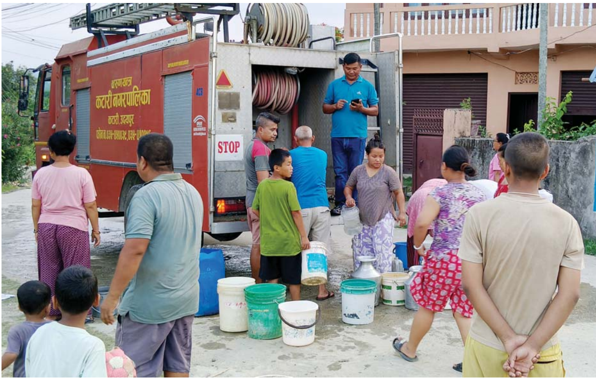
दमकलबाट उदयपुरको कटारी नगरपालिकामा खानेपानीको मोटर बिगिएपछि आइतबार स्थानीयलाई दमकलबाट खानेपानी पानी वितरण गरिँदै।