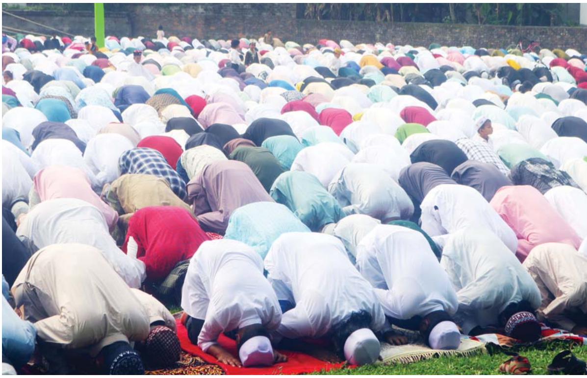
इद उल अजहामा मुस्लिम धर्मावलम्बीको महान् पर्व इद उल अजहा (बकरिद) को अवसरमा बिहीवार विराटनगर-१३ स्थित इदागाहमा सामूहिक प्रार्थना गरिदै नमाज (प्रार्थना) गर्दै ।