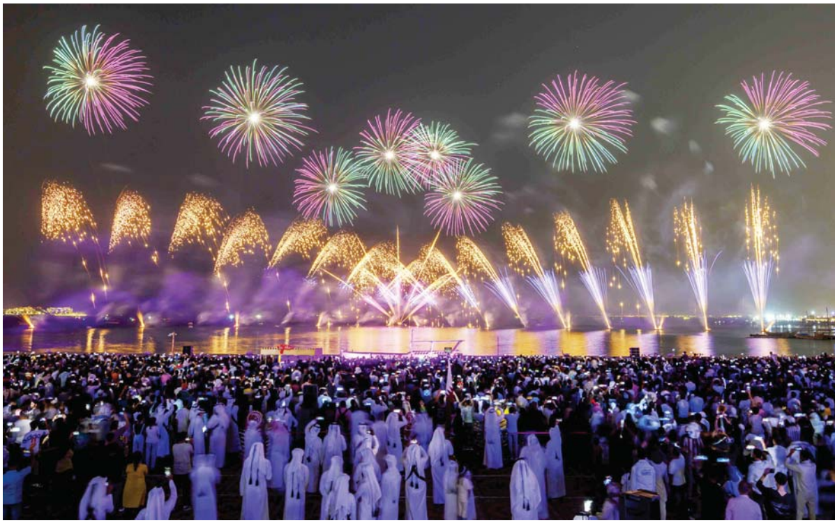
कतारको दोहास्थित 'कतारा कल्चरल भिलेज'मा इद अल-अधाको उत्सवमा बुधवार साँझ गरिएको आतिशबाजी ।