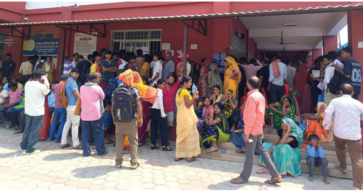
सेवाग्राहीको जिल्ला प्रशासन कार्यालय महोत्तरीमा बुधवार आएका सेवाग्राहीको घुइँचो।

कैलालीमा केही दिनअघि पनि तालिमका क्रममा सशस्त्र प्रहरी बलका जवान 'हित स्टाक'का कारण बेहोस भएका थिए। उनीहरूको अहिले काठमाडौंमा उपचार भइरहेको छ। रासस