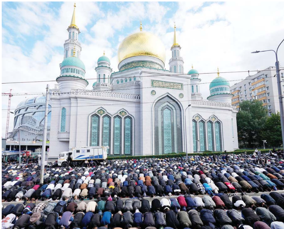
रुसको मस्कोस्थित क्याथेड्रल मस्जिदवाहिर बुधवार ईद अल अधाको नमाज पढ्दै मुस्लिमहरू ।