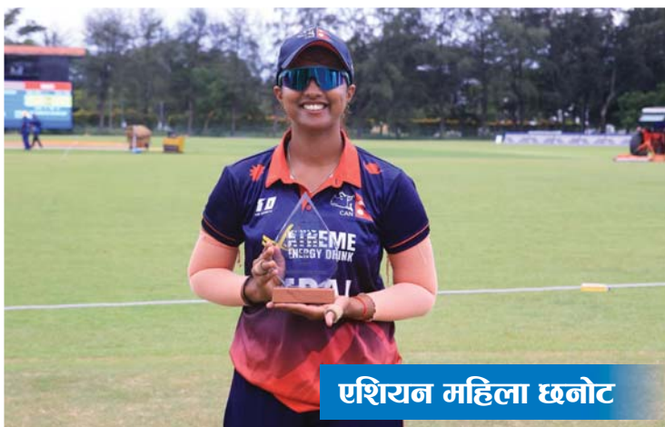
एशियन महिला छनोट