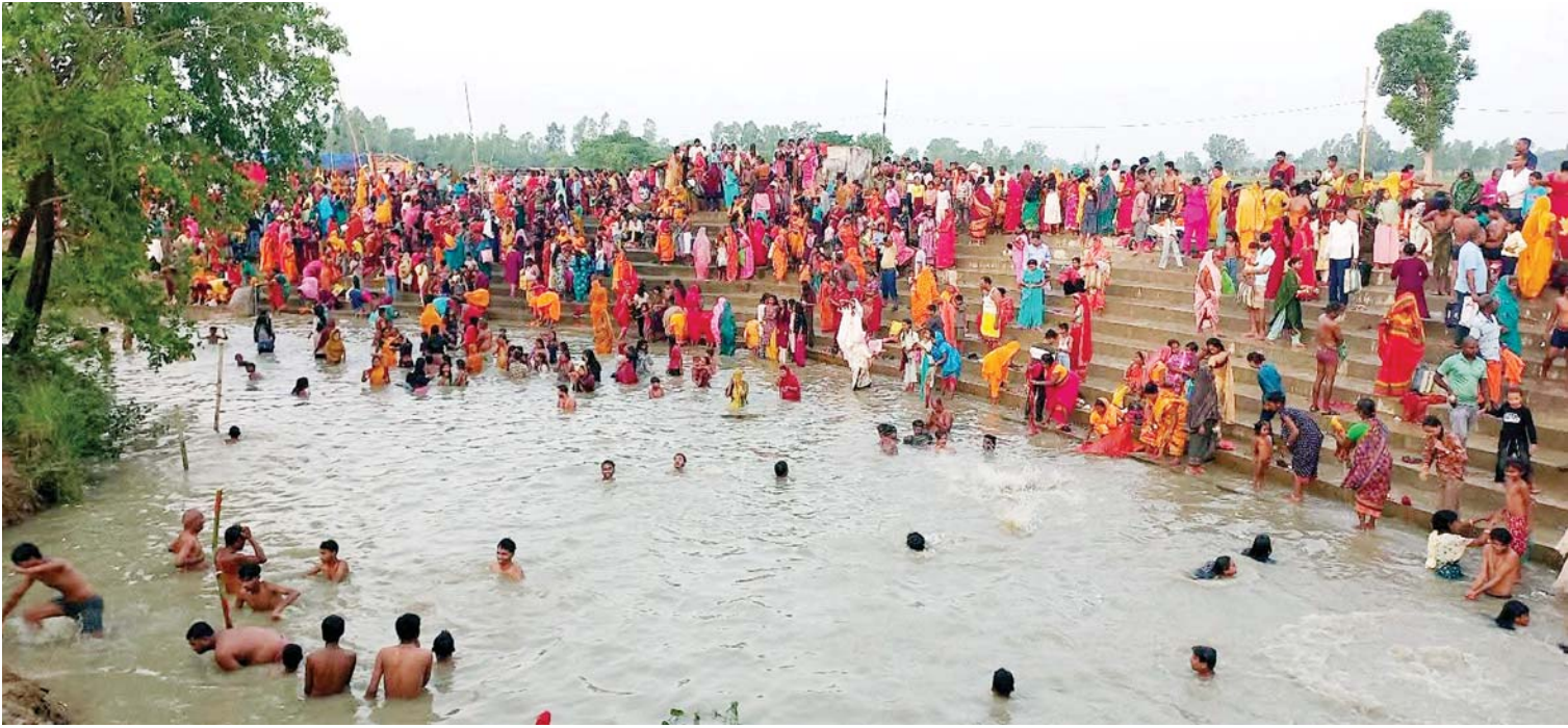
रत्नान गढै प्रत्येक तीन वर्षमा एकपटक पर्ने मलेमास अर्थात् पुरुषोत्तम माससँगै लाग्ने एकमहिने गेरुका स्नान मेलामा आइतवार महोत्तरीको लोहारपट्टी नगरपालिका-४ खुद्रा भक्तजन पारिपरीस्थित गेरुका नदीमा मलेमास स्नान गर्दै भक्तजन ।