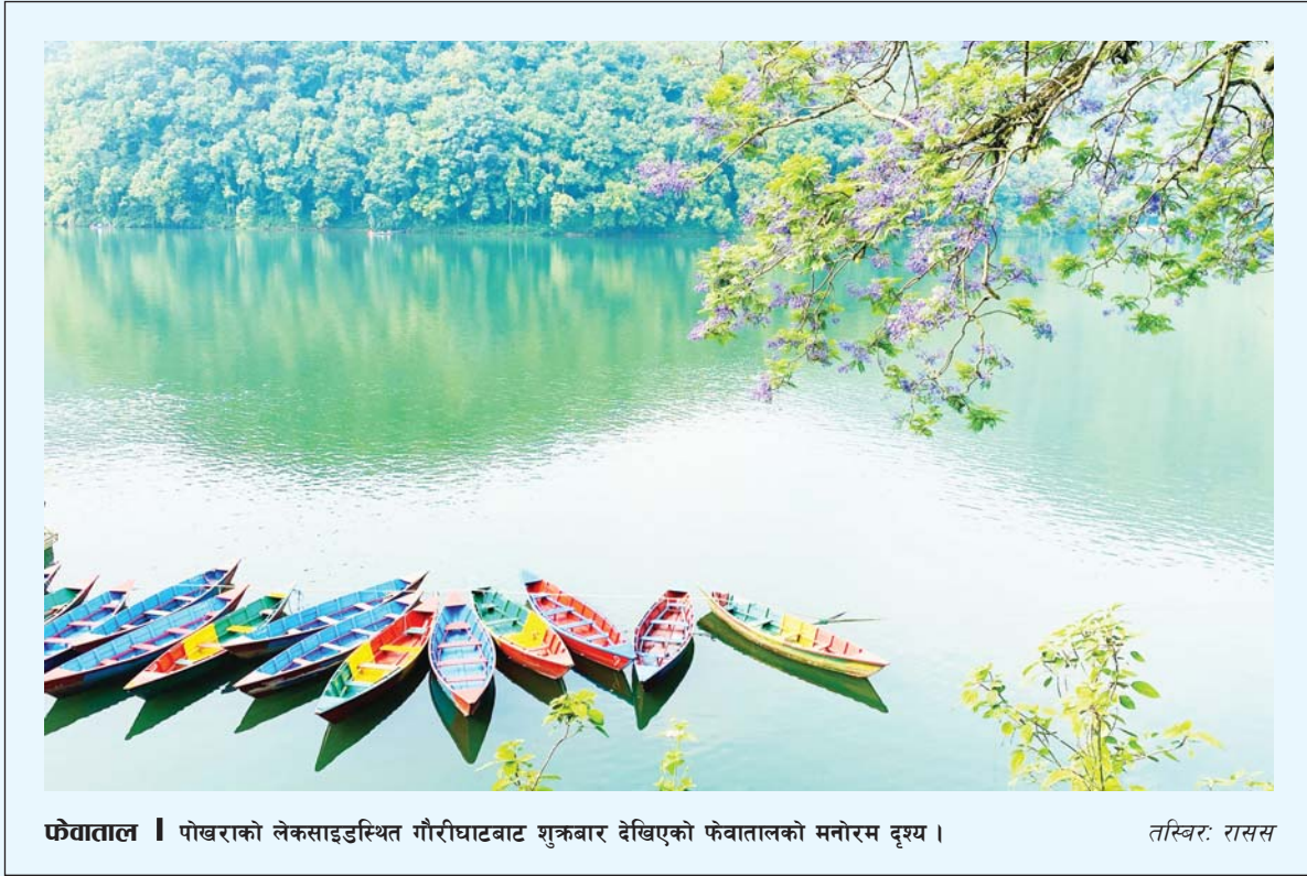
फेवाताल | पोखराको लेकसाइडस्थित गौरीघाटबाट शुरुबार देखिएको फेवातालको मनोरम दृश्य ।