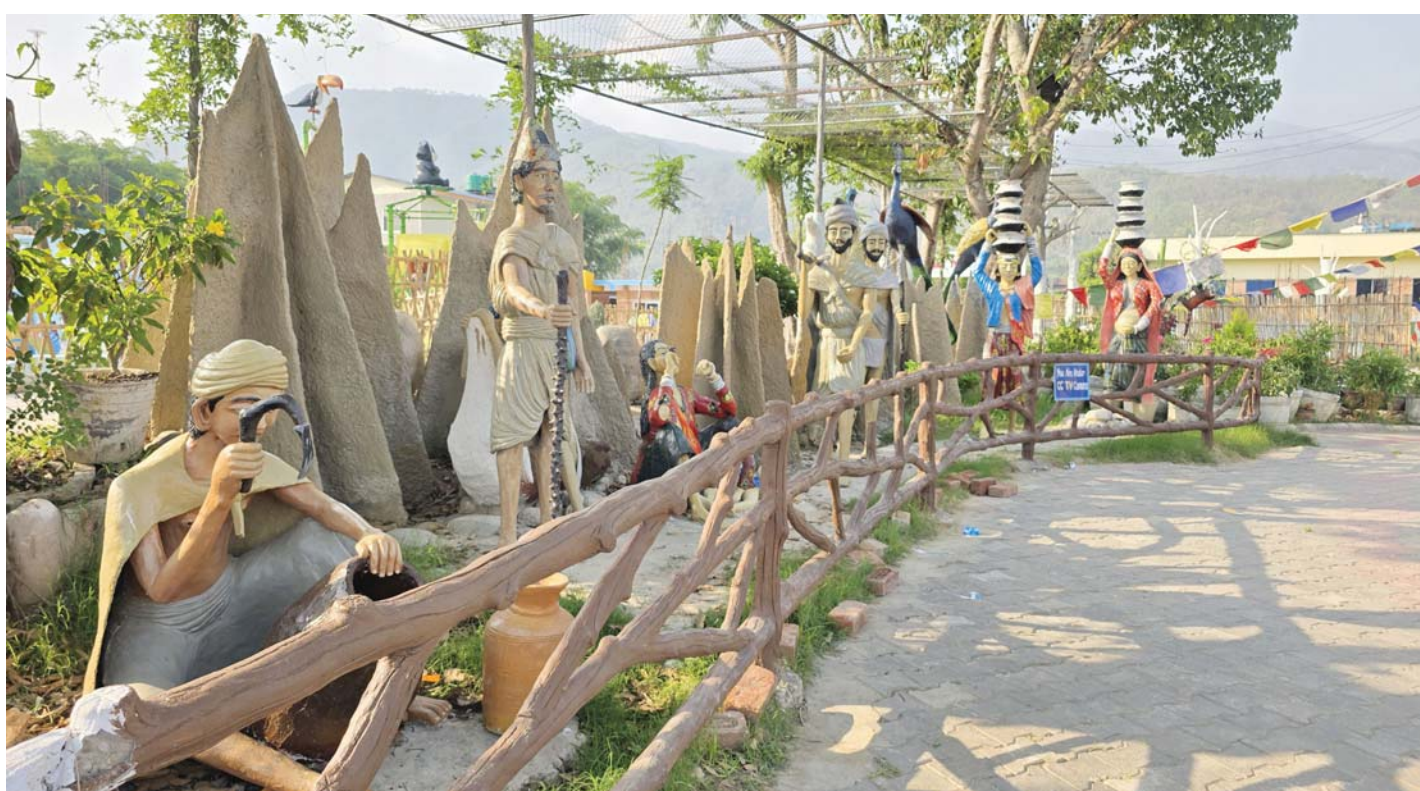
कर्णाली फनपार्क | सुर्खेतको वीरेन्द्रनगर नगरपालिका-३ मा रहेको कर्णाली फनपार्कभित्र राखिएको राउटे संस्कृति फलकले मूर्तिहरू।