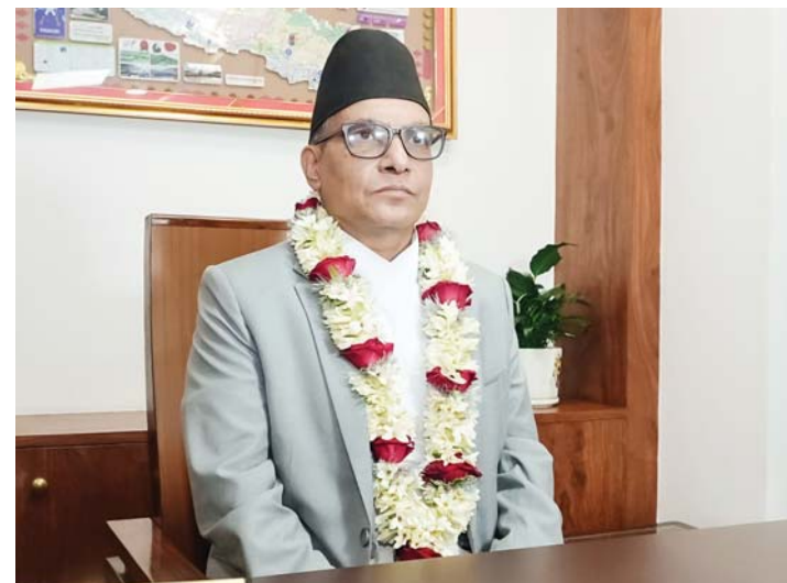
नवनियुक्त प्रधानन्यायाधीश डा. मनोजकुमार शर्मा मंगलबार प्रधानन्यायाधीशको कार्यालयमा पदभार ग्रहण गर्दै।

॥ प्रतिनिधिसभाअन्तर्गतको संसदीय सुनुवाइ समितिबाट मंगलबार द्रुत सुनुवाइमार्फत प्रधानन्यायाधीशमा सिफारिस डा. मनोजकुमार शर्माको अनुमोदन ॥ मंगलबार सौंफ राष्ट्रपतिबाट पद तथा गोपनीयताको शपथ लिएसँगै सर्वोच्च अदालतमा पदभार ग्रहण ॥ वरीयता मिचैर शर्माले प्रधानन्यायाधीश नियुक्त गरिएसँगै न्यायालयभित्र चुलियो विवाद, कायम मुकाम प्रधानन्यायाधीश सपना प्रधान मल्ल नवनियुक्त प्रधानन्यायाधीश डा. शर्माको स्वागत समारोहमा अनुपस्थित ॥ न्यायपालिकाको स्वतन्त्रता र निष्पक्षतामा कुनै हस्तक्षेप स्वीकार नगर्ने नवनियुक्त प्रधानन्यायाधीश शर्माको प्रतिबद्धता