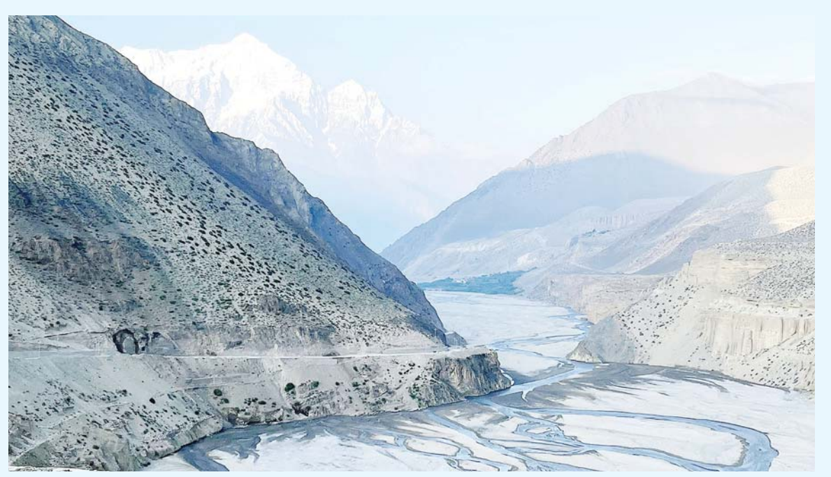
सुन्दर नौलगिरि | मुस्ताङको वारागुड मुक्तिक्षेत्र गाउँपालिका-३ स्थित छुसाडबाट देखिएको नौलगिरि हिमाल ।