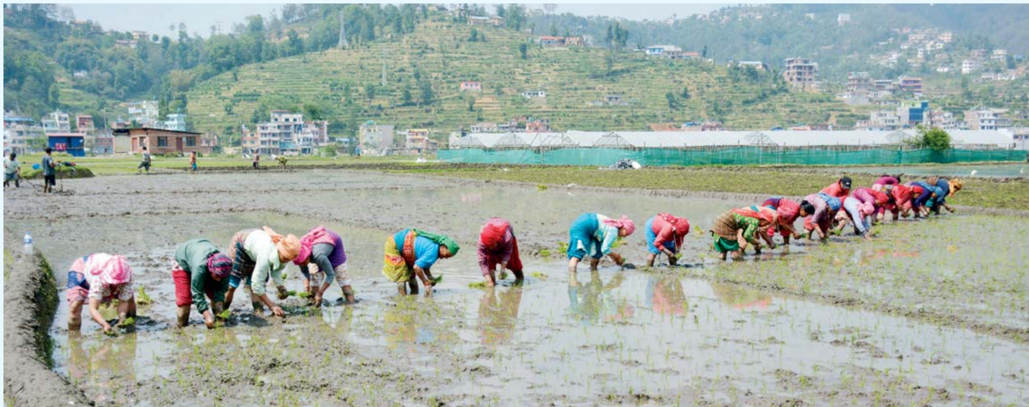
धान रोज्न व्यस्त किसान

काभ्रेपलाञ्चोकको पनौती नगरपालिका-९ भण्डारीगाउँ नजिकैको खेतमा धान रोप्दै किसान ।