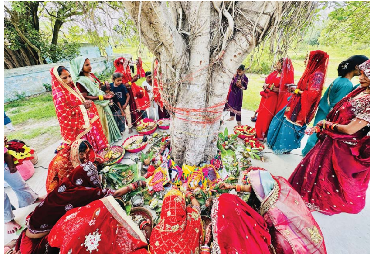
सावित्री पर्व | धनुषाको विदेह नगरपालिका-८ बर्फैस्थित तपेश्वरी स्थानमा शनिवार बिहान वरको रुख पूजा गरेर वट सावित्री पर्व मनाउँदै स्थानीय

मार्गशीर्ष शुक्ल पूर्णिमाका दिन वाली भित्रचयाएर जाडो छल्ल बैसी भरेका मानिस पनि उँभो लाग्छन्। उँभोको अर्थ खेतीपाती राम्रो होस्, धेरै होस्, उन्नति होस् भन्ने पनि रहेको भनाइ छ। यसै कारणले वैशाख पूर्णिमाका किराँत समुदायद्वारा मनाइने यस चाड 'उभो' शब्दबाट प्रेरित भएर 'उभौली' को नामले चिनिने तथा मनाइने गरिएको भनाइ छ। यस दिनलाई किराँत समुदायले सुनिमा अर्थात् देवी पार्वतीको स्मृति भएको दिनका रूपमा पनि मान्ने गरेका छन्। सांस्कृतिक दृष्टिले पनि अत्यन्तै महत्त्वपूर्ण रहेको किराँत समुदायभित्रका चाँस्दि, वान्तावा, सुनुवार, राई, याक्खा, लिम्बूलगायत जातिहरूले यस उभौली चाडलाई महान चाडका रूपमा मनाउने गरेका छन्। रासस