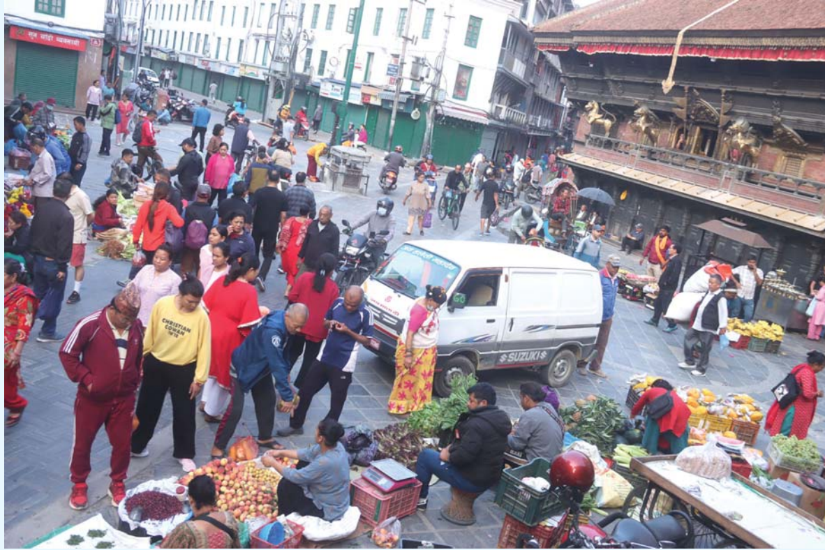
इन्द्रचोकमा किनमेल | काठमाडौंस्थित इन्द्रचोकमा शनिबार बिहान तरकारी, फलफूल लगायत सामग्री किनमेल गर्दै सर्वसाधारण।