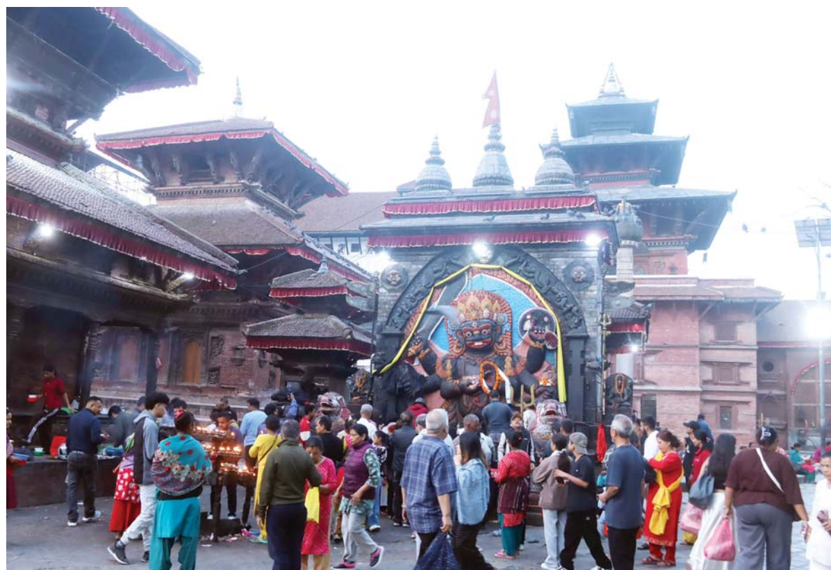
कालभैरव मन्दिरमा भक्तजन

काठमाडौंस्थित हनुमानढोका दरवार क्षेत्रमा रहेको कालभैरव मन्दिरमा शनिवार बिहान पूजाअर्चना गर्दै भक्तजन ।