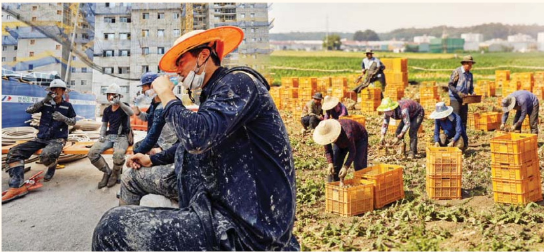
तरिवरः सामाजिक सञ्जालबाट

काठमाडौं- मौसमविद्हरूले असामान्य गर्मीको चेतावनी दिएसँगै दक्षिण कोरियाका आउटडोर (बाहिर काम गर्ने) श्रमिकहरू जोखिममा पर्ने जनाइएको छ। विशेषगरी निर्माण तथा कृषि क्षेत्रमा काम गर्ने श्रमिकहरू उच्च तापक्रमकै कारण स्वास्थ्य समस्या र मृत्युसम्मको जोखिम पर्ने खतरा औल्याइएको छ। मौसमविद्हरूको यस वर्षको गर्मी विगतको जस्तै या त्यो भन्दा पनि खराब हुने प्रक्षेपण गरेको द कोरिया टाइम्सले उल्लेख गरेको छ। स्वास्थ्य अधिकारीहरूका अनुसार पछिल्ला वर्षहरूमा तातो बढ्दै गएसँगै यससँग सम्बन्धित रोगका विरामीहरूको संख्यामा ठूलो बृद्धि भएको छ। अधिल्लो वर्ष उच्च तापका कारण विरामी हुनेको संख्या चार हजार ४६० पुगेको थियो। जबकि, सन् २०११ मा