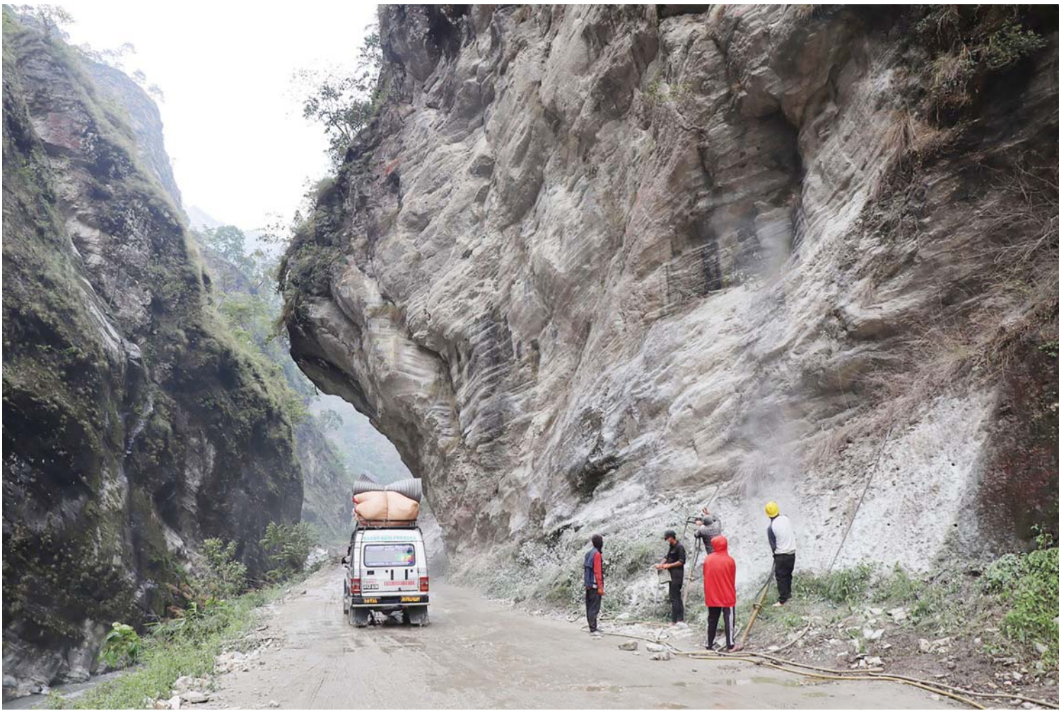
महभिरसडक | कालीगण्डकी कोरिडोर सडकअन्तर्गत म्याग्दीको अन्नपूर्ण गाउँपालिका-७ महभिरस्थित पहाडमा विष्फोटक पदार्थको प्रयोग गरी सडक फराकिलो पार्न 'डिलिड' गरिँदै ।