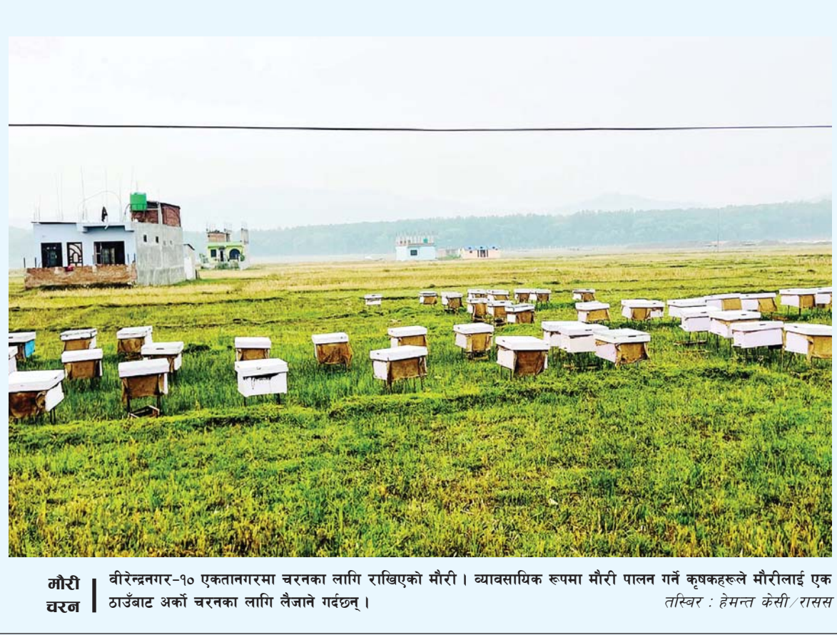
मौरी चरण | वीरेन्द्रनगर-१० एकतानगरमा चरणका लागि राखिएको मौरी। व्यावसायिक रूपमा मौरी पालन गर्ने कृषकहरूले मौरीलाई एक ठाउँबाट अर्को चरणका लागि लैजाने गर्दछन्।