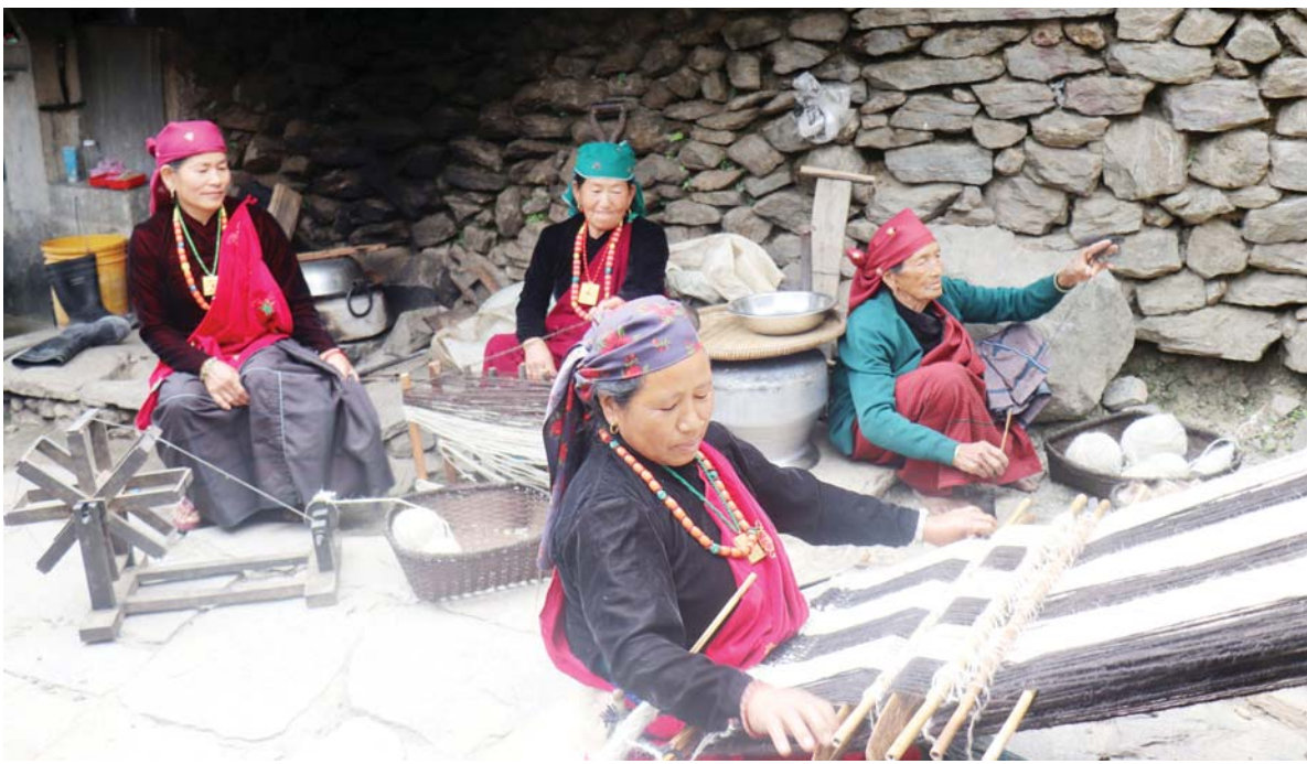
परम्परागत पेशा | लमसुङको मस्याङ्दी गाउँपालिका-४ स्थित परम्परागत पेशाको रूपमा रहेको भेडावाखाको ऊन काढ्ने र तानमा बुन्ने मित्रा गाउँका स्थानीय महिला ।