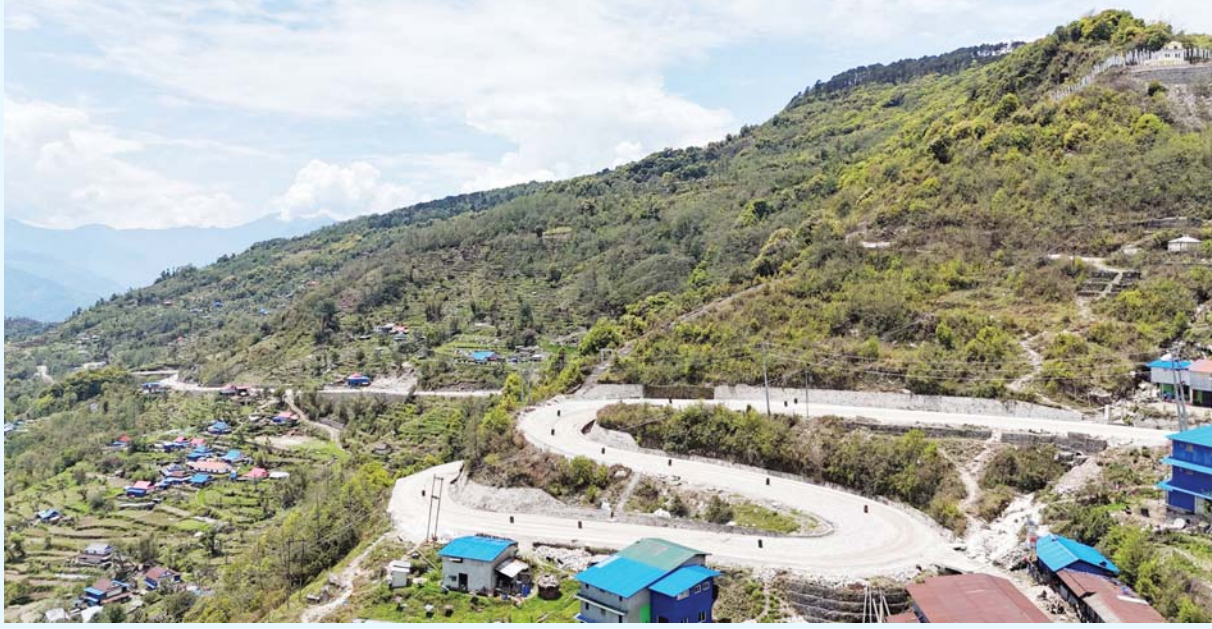
खाँदवारी-किमाथाका सडक खण्ड | उत्तर-दक्षिण कोशी राजमार्ग संखुवासभाको खाँदवारी नगरपालिका- ४ स्थित एक हजार ८९० मिटर उचाइको छायाडकुटी डाँडावाट देखिएको खाँदवारी-किमाथाका सडक खण्ड।