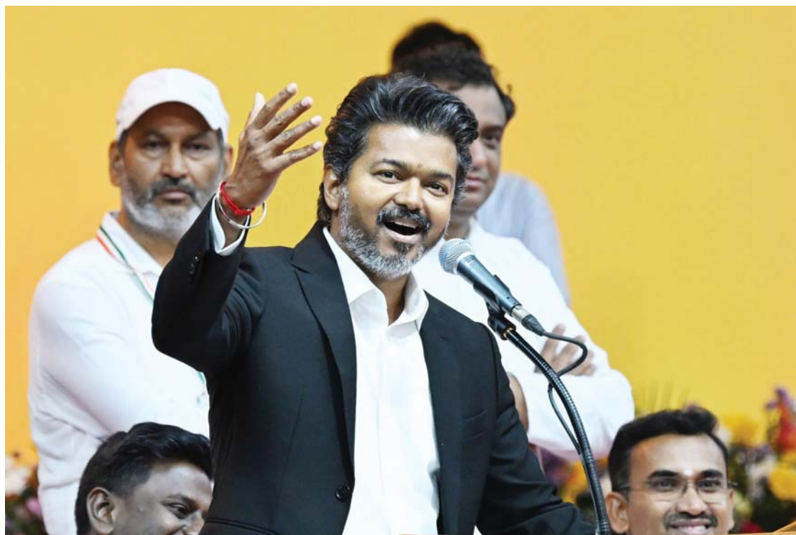
अभिनेताबाट राजनीतिज्ञ बनेका तमिलनाडु वेवी कभ्रम (टिभिके) पार्टीका नेता जोसेफ विजय भारतको चेन्नईमा तमिलनाडु राज्यको मुख्यमन्त्रीको रूपमा शपथ लिएपछि बोल्दै ।