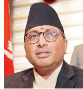
डा. स्वर्णिम बगले, अर्थमन्त्री