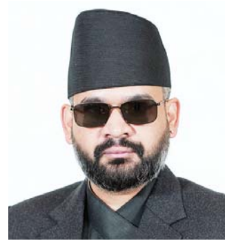
बालेन्द्र शाह, प्रधानमन्त्री