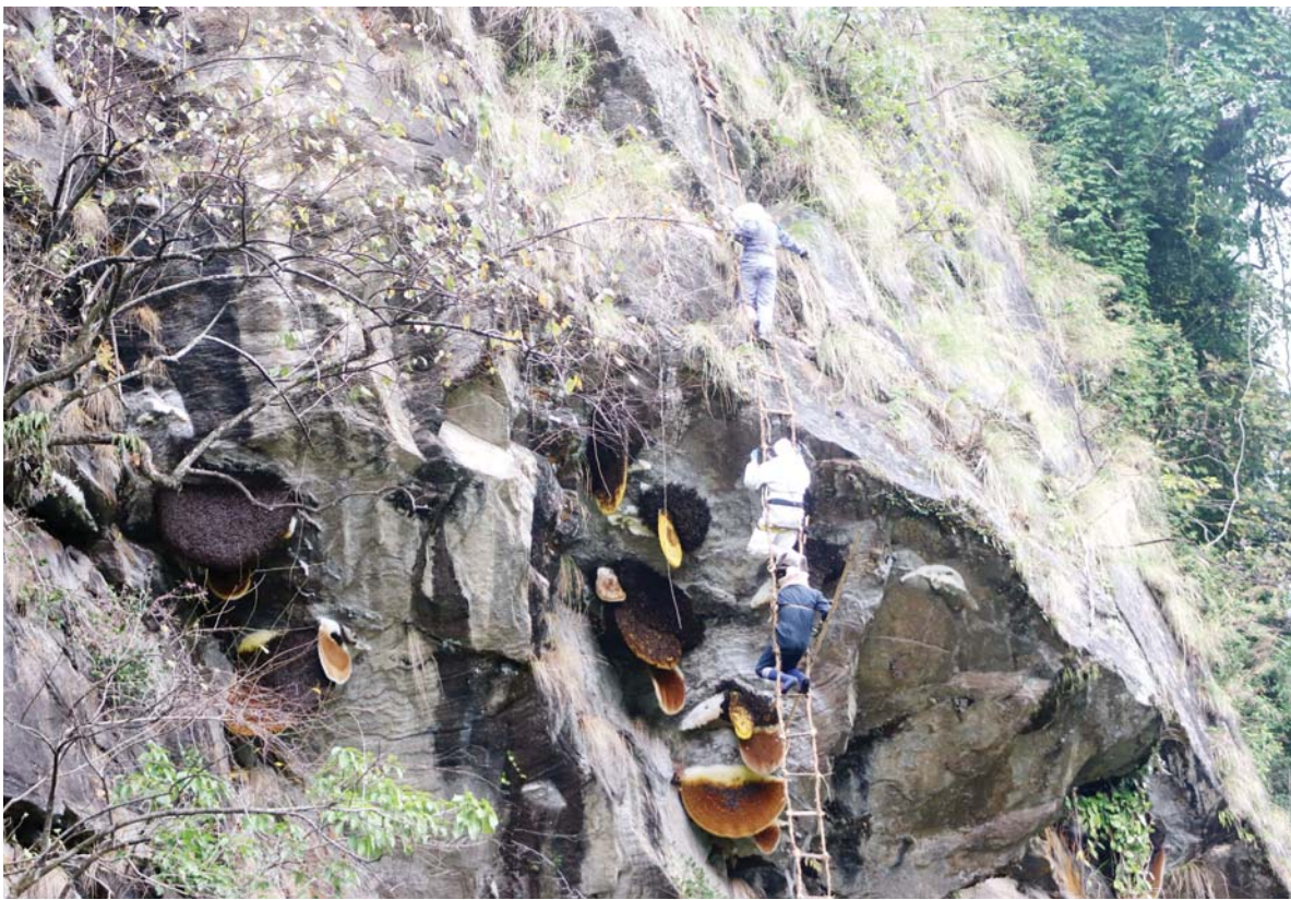
मह काट्दै | मनाङको मर्याङ्दी गाउँपालिका-४ स्थित स्याँग भरनाको भीरमा मह काट्दै मिप्रा गाउँका स्थानीय ।