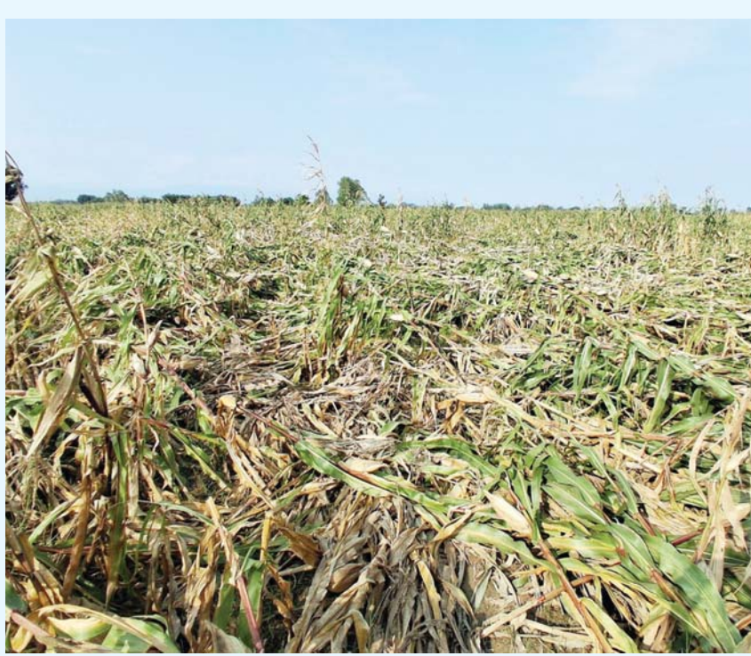
हुँदोले मकै दुई दिनअघि आएको हावाहुरी र वर्षाले क्षति पुऱ्याएको सुनसरीको इनरुवा सौतर... नगरपालिका-९ स्थित किसानको मकै बाली।