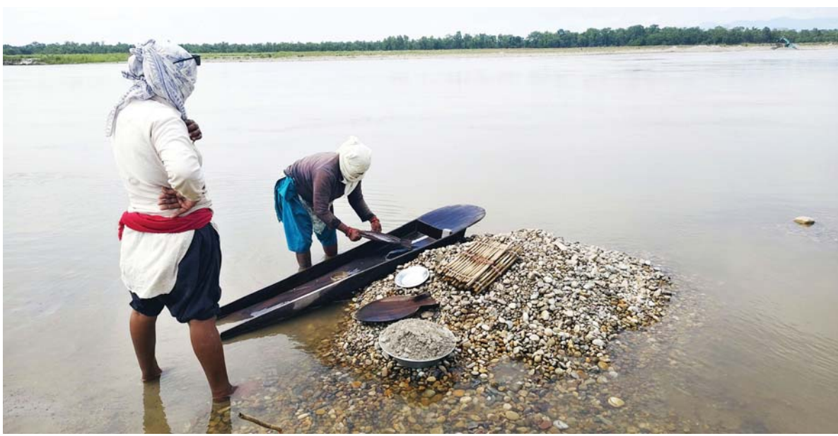
कर्णाली नदीमा सुन खोज्दै | कैलाली र बर्दिया जिल्ला हुँदै बग्ने कर्णाली नदीमा सुन खोज्न नदीको बालुवा चाल्दै सोनाहा जतिका महिला।