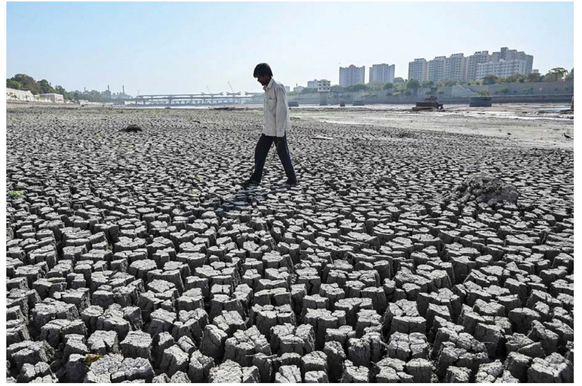
भारतको अहमदाबादस्थित साबरमती नदीको सुख्खा किनारमा हिँड्दै एक मानिस। जलवायु परिवर्तनको प्रभावले यहाँका जमिनहरू सुख्खा बनेका छन्।

यो प्रतिवेदनले सरकारहरूलाई समावेशी विकास, दिगोपन तथा जनकल्याणलाई प्राथमिकता दिई प्रभावकारी नीति निर्माणमा सहयोग पुग्ने विश्वास व्यक्त गरिएको छ। साथै, विकासलाई केवल आर्थिक उपलब्धिमा सीमित नराखी मानव जीवनको गुणस्तर र प्रकृतिको संरक्षणसँग जोडेर हेर्नुपर्ने आवश्यकता पनि प्रतिवेदनले औल्याएको छ। रासस/सिन्हा