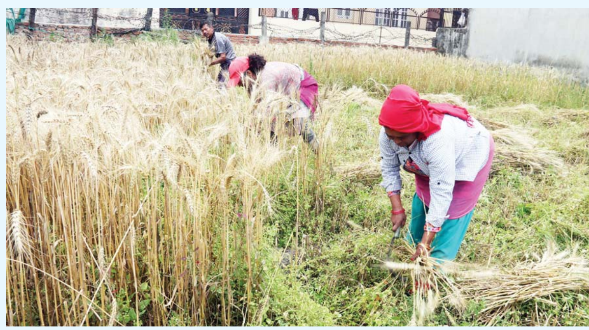
गहुँ स्याहाउँ काठमाडौंको तारकेश्वर नगरपालिका-१० मनमैजुस्थित खेतमा शुरुवार गहुँ काट्दै किसान।