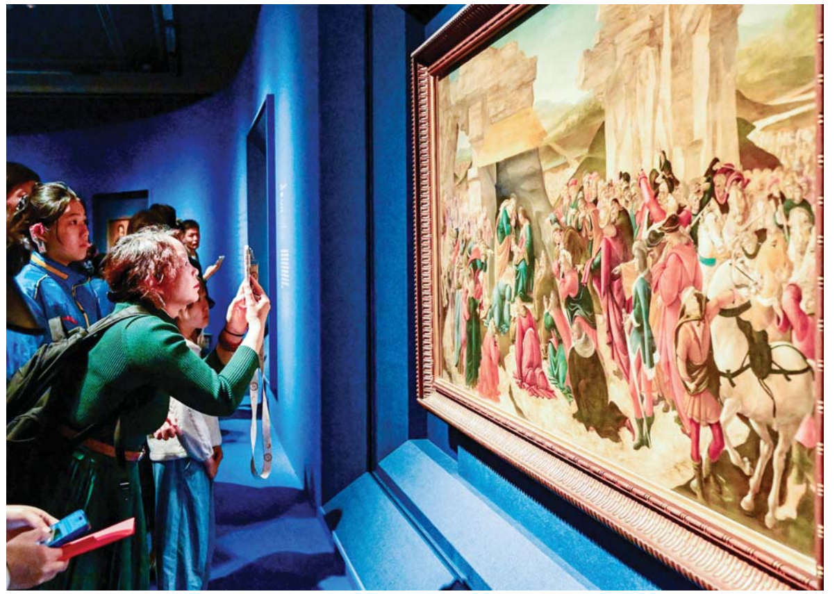
चीनको राजधानी बेइजिङस्थित राष्ट्रिय कला संग्रहालयमा रहेको 'भञ्जोसोसलाई श्रद्धाञ्जलि: लियोनार्डो दा भिञ्चीदेखि काराभाजियोसम्म-इटालियन पुनर्जागरणका उत्कृष्ट कृतिहरू' प्रदर्शनी अवलोकन गर्दै मानिसहरू।

वातावरणविद्हरूले अन्टार्क्टिकालाई विश्वका अन्य संवेदनशील पारिस्थितिकीय क्षेत्रसह कडाइका साथ नियमन गर्न आवश्यक रहेको बताएका छन्। उनीहरूका अनुसार अहिलेको बृद्धिरदलाई बेवास्ता गरिए भविष्यमा यो अमूल्य भूभाग गम्भीर क्षतिको सामना गर्ने सक्छ। रासस/एपी