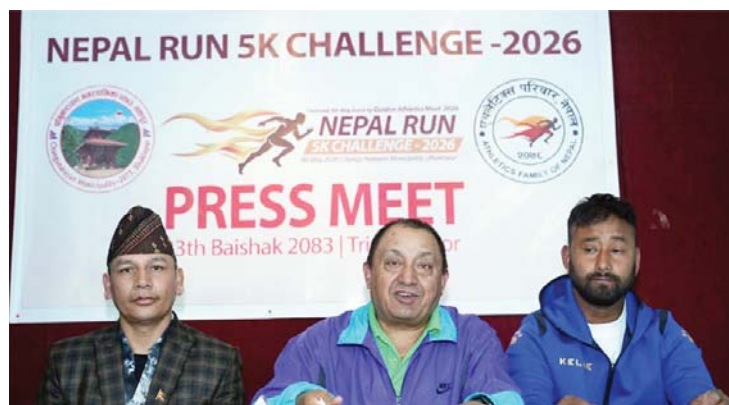
गरिनेछ। करिव २५० भन्दा बढी धावक सहभागी हुने अपेक्षा गरिएको छ। खुला ५ किलोमिटरतर्फ प्रथम हुनेले १२ हजार, द्वितीयले ८ हजार र तृतीयले ४ हजार

प्रतियोगितामा खुला महिला तथा पुरुष ४५ वर्षमाथि पुरुष भेटानतर्फ ५ किलोमिटर दौड हुनेछ। त्यस्तै, १८ वर्षमाथि महिला तथा पुरुष ३५ वर्षमाथि महिला भेटानतर्फ ३ किलोमिटर दौड आयोजना