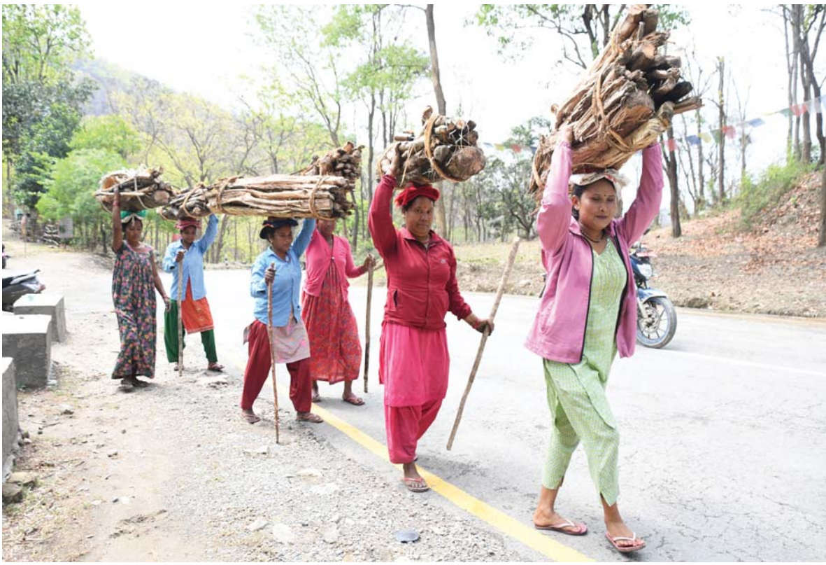
दाउराको जोडो | दाउराको घोराली उपमहानगरपालिका-३ स्थित फिङ्की गाउँका थारु महिला जंगलबाट दाउराको भारी बोकेर घरतर्फ फर्किदै।