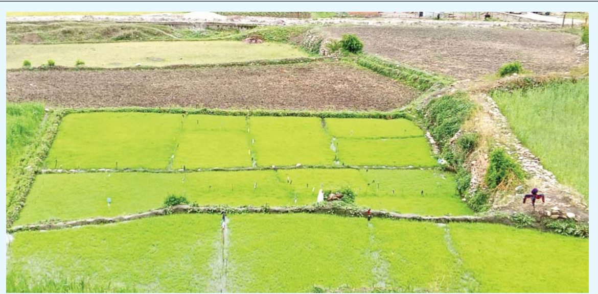
जुम्लाको मासी | जुम्लाको चन्दननाथ नगरपालिका-५ का किसानको खेतमा हरियाली भएको मासीधानको बीउ।