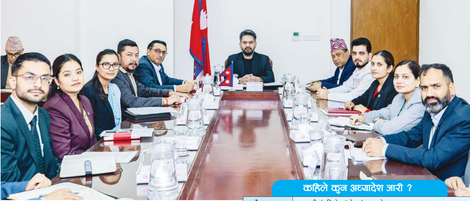
कहिले कुन अध्यादेश जारी ?

वैशाख २८ गते संघीय संसद्का दुवै सदनको अधिवेशन सुरु हुने