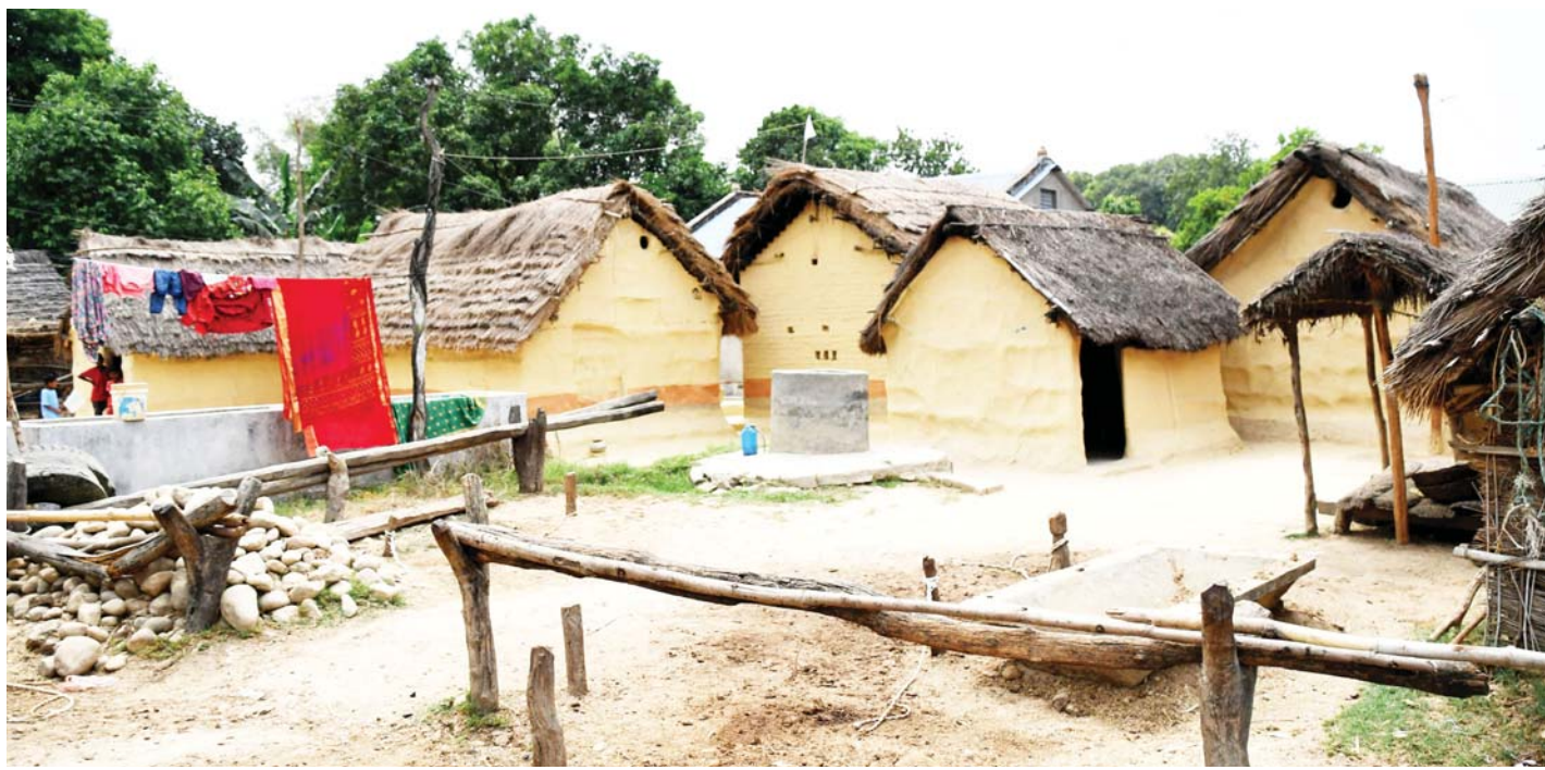
परम्परागत खरले छाएका घर | दाङको राजपुर गाउँपालिका-३ स्थित प्रतापपुर गाउँमा स्थानीय याव समुदायका परम्परागतरूपमा खरले छाएका घरहरू।