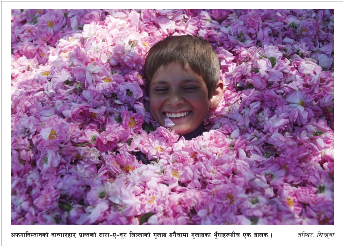
अफगानिस्तानको नामगारहार प्रान्तको दारा-ए-नूर जिल्लाको गुलाब बगैँचामा गुलाबका थुंगाहरूबीच एक बालक ।