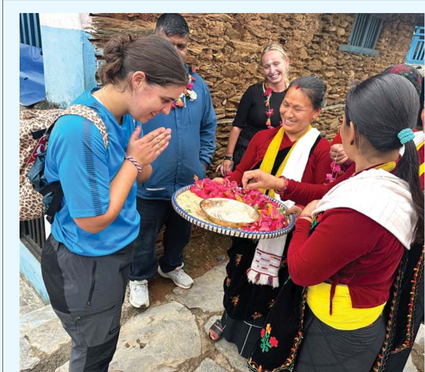
पर्यटकलाई स्वागत तनहुँको बन्दीपुर गाउँपालिका-३ स्थित रामकोट गाउँमा घुम्न आएका विदेशी पर्यटक। मगर समुदायको बाहुल्यता रहेको यस गाउँका अधिकांश घर ढुंगाले छाएका र घर अगाडी आँगनमा ढुंगा विछ्याइएका र मकैको सुली राखिएका छन्।