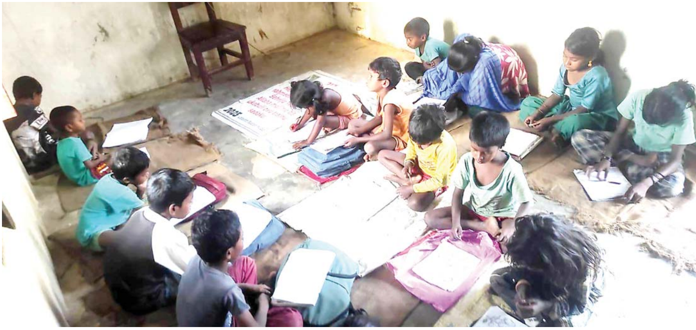
निःशुल्क ट्यूसन कक्षा | सिरहाको लहान नगरपालिकाद्वारा दलित बस्तीमा सञ्चालित निःशुल्क ट्यूसन कक्षमा रमाउँदै पढ्दै गरेका बालबालिका ।