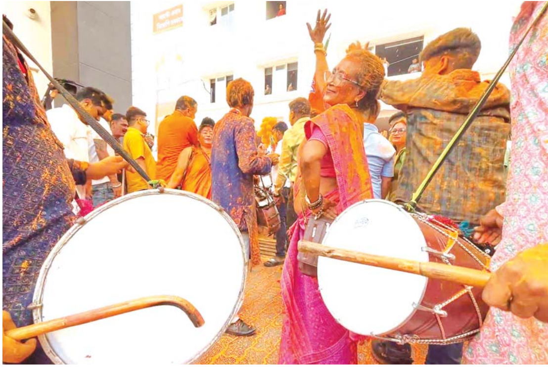
भारतको गुवाहाटीमा हालै सम्पन्न राज्य चुनावको प्रारम्भिक नतिजामा आफ्नो पार्टीले अग्रता लिँदा सोमबार भारतीय जनता पार्टीका कार्यकर्ताहरू नारा लगाएर खुसी मनाउँदै।