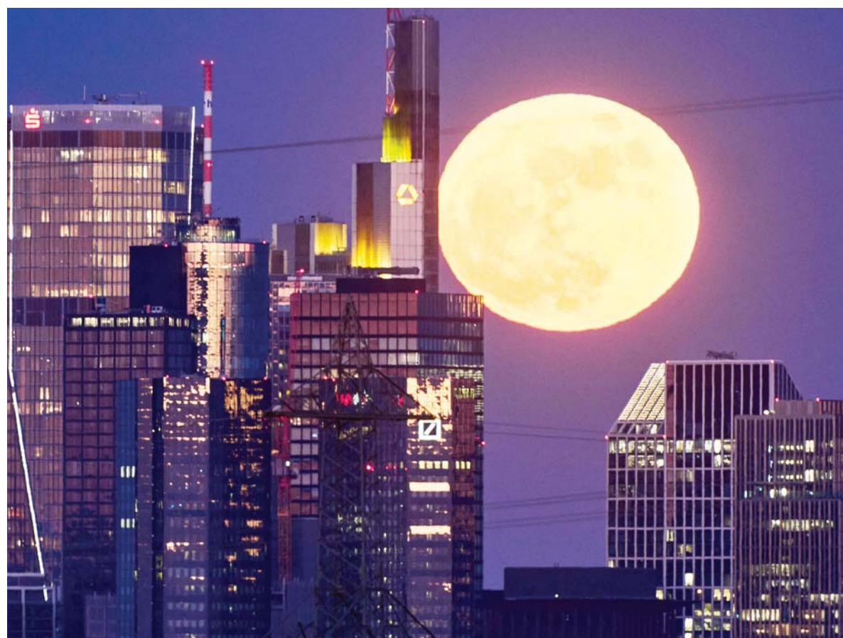
जर्मनीको फ्रान्कफर्टमा रहेको बैकिङ जिल्लाका भवनहरू पछाडि शुक्रबार उदाउँदै गरेको जून।

रुसी पक्षले मध्यस्थता तथा कूटनीतिक पहलहरूलाई निरन्तर समर्थन गर्ने आफ्नो प्रतिबद्धता दोहोर्‍याउँदै, सबै पक्षलाई संवाद र समझदारीमाफत समाधान खोज्न प्रोत्साहित गरेको छ। साथै, दीर्घकालीन शान्ति र स्थिरता कायम गर्न राजनीतिक प्रक्रियालाई अघि बढाउन सहयोग गर्ने तयारी पनि व्यक्त गरिएको छ। वार्तामा अन्तर्राष्ट्रिय समुद्री मार्गहरूको सुरक्षित सञ्चालन, विशेषगरी होर्मुज जलडमरू हुँदै रुसका जहाज तथा मालसामानको सुरक्षित आवागमन सुनिश्चित गर्ने विषयमा पनि सौहार्दपूर्ण छलफल भएको जनाइएको छ। दुवै पक्षले यस विषयलाई अन्तर्राष्ट्रिय व्यापार र ऊर्जा आपूर्तिको दृष्टिले अत्यन्त महत्त्वपूर्ण मानेका छन्। यो संवादलाई दुवै देशबीचको निरन्तर कूटनीतिक सम्पर्क र क्षेत्रीय शान्ति तथा स्थिरताप्रति साझा प्रतिबद्धताको सकारात्मक संकेतका रूपमा लिइएको छ। रासस/सिन्हवा