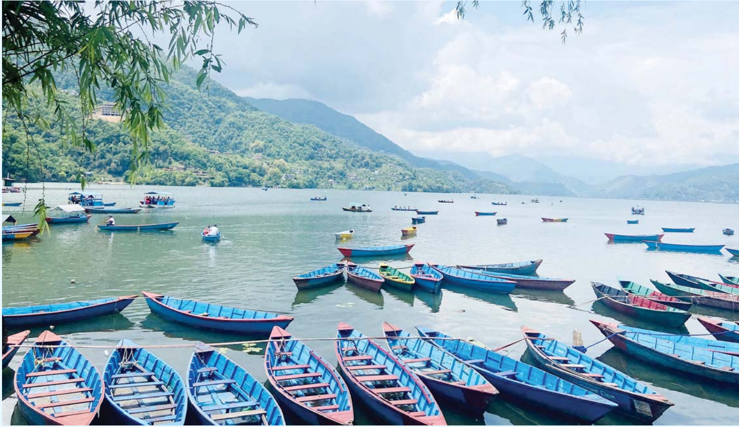
पर्यटकको पर्याप्तता... पर्यटकीय राजधानी पोखराको फेवातालमा शनिबार पर्यटकको पखाइमा ढुंगा व्यवसायी। पछिल्लो समय शनिबार र आइतबार सार्वजनिक बिदा भएपछि आन्तरिक