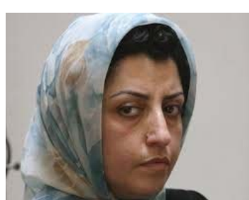
स्वास्थ्यको बारेमा महिनौंदेखि चेतावनी दिँदै आएको र मार्चको अन्त्यमा उनलाई

पेरिस- स्वास्थ्यमा समस्या आएपछि इरानकी नोबेल शान्ति पुरस्कार विजेता नर्गिस मोहम्मदीलाई उपचारका लागि इरानको अस्पतालमा भर्ना गरिएको उनका समर्थकहरूले बताएका छन्। दुई दशकभन्दा बढीको अधिकार अभियानको आधारमा सन् २०२३ मा शान्ति पुरस्कार जितेकी मोहम्मदीलाई इरानका धर्मगुरु अधिकारीहरूविरुद्ध बोलेको आधारमा गत डिसेम्बरमा पूर्वी सहर मशादाबाट पक्राउ गरिएको थियो। उनका समर्थकहरूले उनको