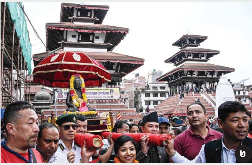
१. 'बुद्धसभा'मा दिप प्रज्वलन गर्दै राष्ट्रपति रामचन्द्र पौडेल । २. बुद्धजयन्तीका अवसरमा आज काठमाडौंको स्वयम्भूनाथ चैत्यमा पूजा आराधना तथा दर्शन गर्न आएका भक्तजन । ३. बुद्धजयन्तीका अवसरमा शुक्रबार तनहुँको दमौलीमा निकालिएको शान्ति पदयात्रामा सहभागीहरू । ४. मेलम्ची घ्याङ गुठीले २५७० औं बुद्ध जयन्तीका अवसरमा शुक्रबार बौद्धमा आयोजित शान्ति यात्राका क्रममा बुद्ध मूर्ति नगर