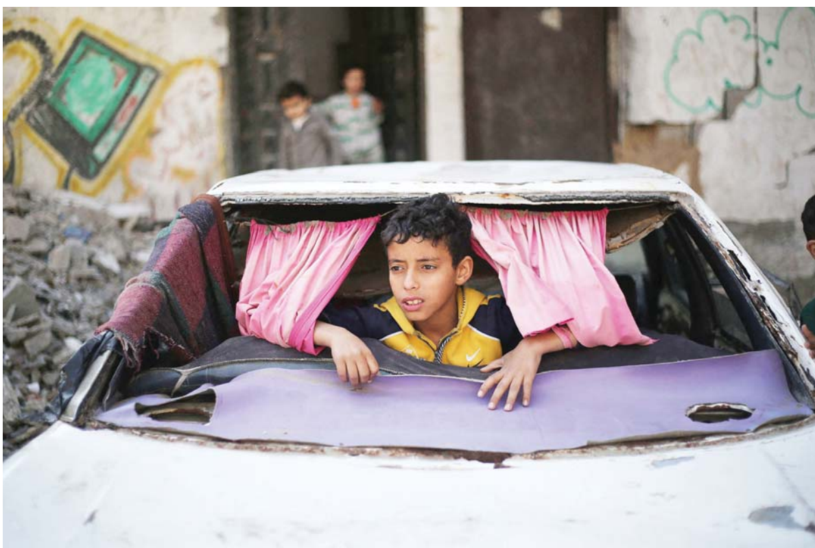
मे दिवसको दिन घरबारबिहीन प्यालेस्टिनी बालक गाजास्थित बुरुइज शरणार्थी शिविरमा भग्नावशेष कारमा खेल्दै ।