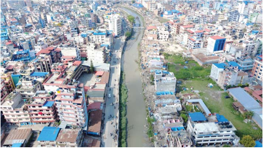
काठमाडौं महानगरपालिका-१६ विष्णुमती खोलाको दायाँबायाँको किनारमा रहेको सुकुमबासी बस्तीका घरटहर।