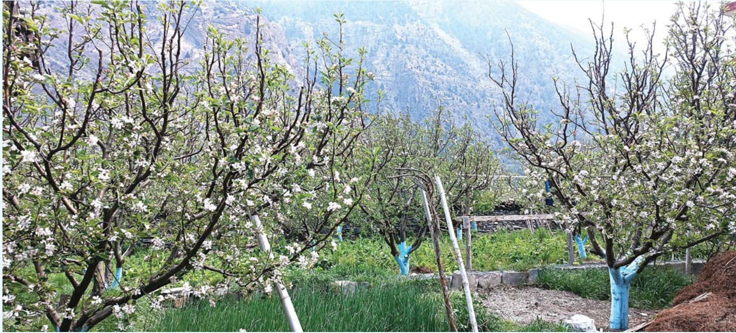
ढकमक्क फुलेको फूल। यस वर्ष अत्यधिक हिमपात भएको कारण स्याउको बोटमा पर्याप्त फूल फुलेको छ।