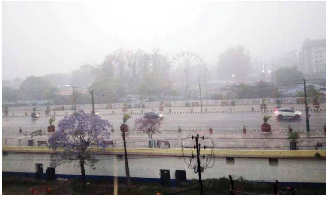
हावाहुरीसहितको वर्षा काठमाडौंमा बुधवार साँझ हावाहुरीसहितको वर्षाका कारण साँझ ५ बजे नै अँध्यारो भएपछि...।