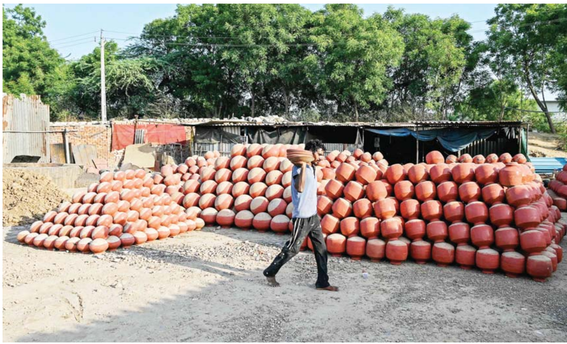
भारतको अहमदाबादको बाहिरी इलाकामा गर्मी याममा पानी भण्डारण गर्न प्रयोग गरिने माटोका भाँडाहरू साँदै एक कामदार ।