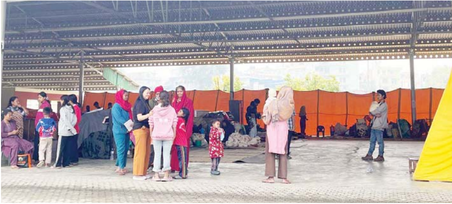
कीर्तिपुरस्थित होल्डिङ सेन्टरमा राखिएका सुकुमबासीहरू।

सरकारले सार्वजनिक गरेन स्थायी व्यवस्थापनको योजना