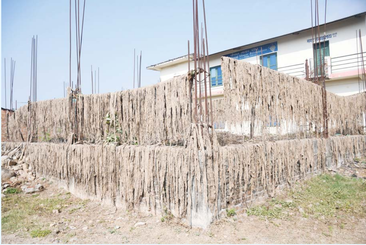
डाडको घोरही उपमहानगरपालिका-१३ स्थित विश्वासिलो अल्लो धागो तथा कपडा उद्योगमा धागो बनाउन प्रशोधनपछि धाममा सुकाइएको अल्लोको रेसा।