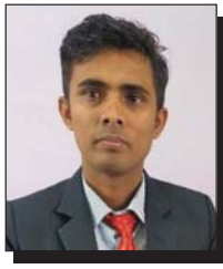
□ रिसव गौतम

सार्वजनिक सम्पत्ति व्यक्तिको वा संस्थाको स्वार्थ अनुकूल प्रयोग हुन सक्दैन भन्ने नजिर स्थापना गर्न त्रिवि अब पछि हट्नु हुँदैन। सरकारले पनि यो अभियानलाई पूर्ण सुरुका र प्रशासनिक सहयोग उपलब्ध गराउनुपर्छ। अतिक्रमित भूमि फिर्ता गरी त्रिविलाई एक व्यवस्थित र आधुनिक शैक्षिक केन्द्रका रूपमा विकास गर्ने यो अवसरलाई गुम्न दिनु हुँदैन।