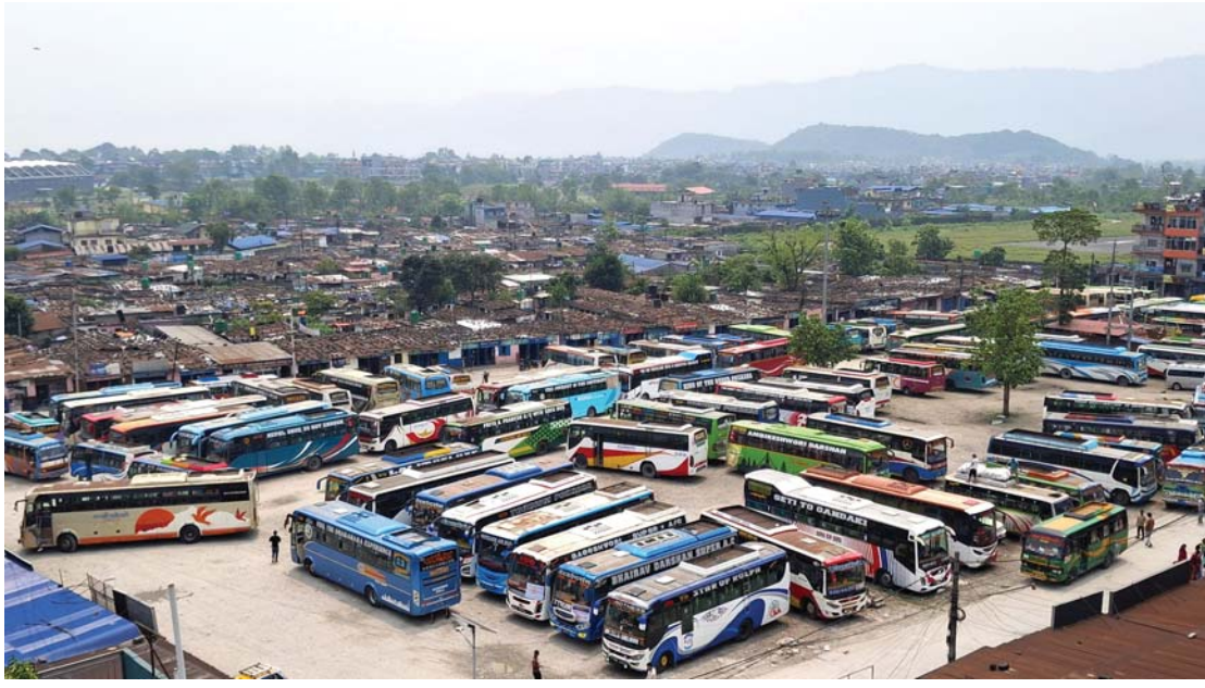
अतिक्रमणले सामुहिक पोखरा बसपार्क देशको पर्यटकीय राजधानी पोखरास्थित पृथ्वीचोकमा अवस्थित बसपार्कको जमिनमा बनेका संरचनाका कारण खुम्चिएको बसपार्क।