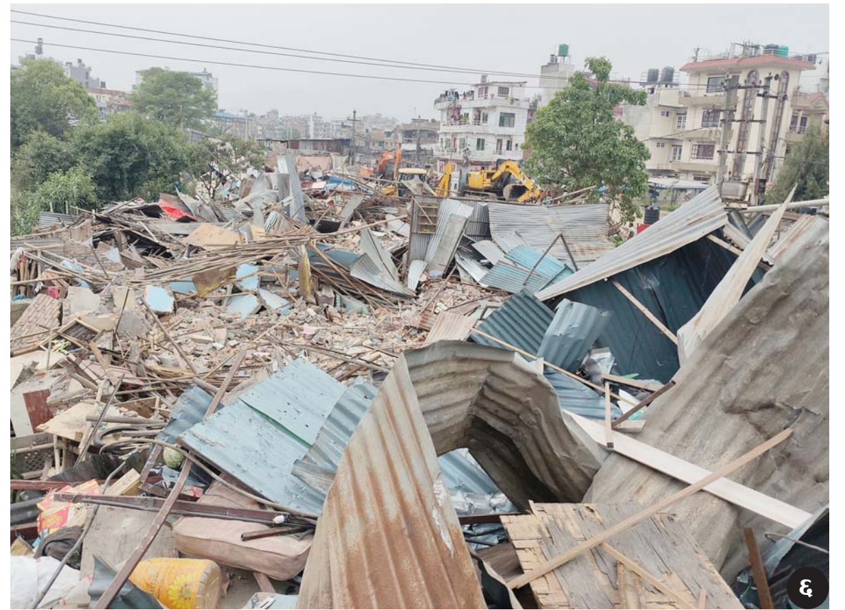
१) २) काठमाडौंको थापाथलीस्थित सुकुमबासी बस्तीमा निर्माण गरिएका घर टहरासहितका संरचना भत्काउन शनिबार डोजर लगाइँदै । ३) थापाथलीस्थित बागमती नदी किनारमा बसोबास गर्दै आइरहेका सुकुमबासी/भूमिहीनको त्रिपुरेश्वरस्थित दशरथ रंगशालामा लगत संकलन गरिँदै ।