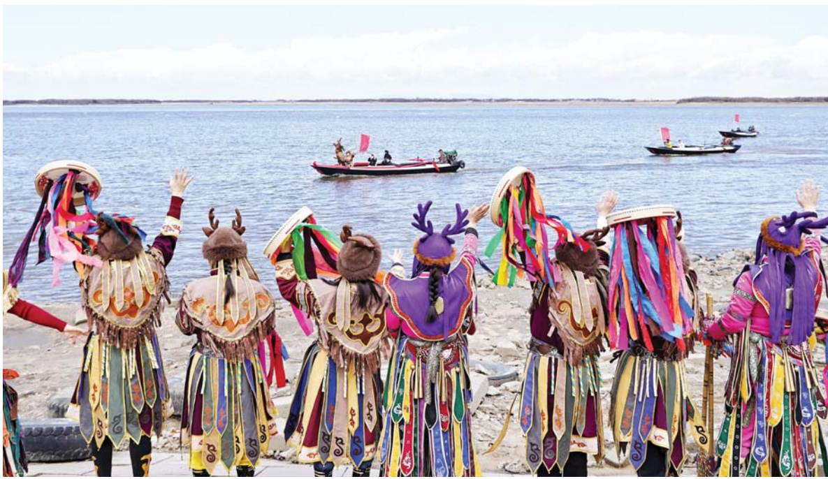
चीनको हेइलोजियाङ प्रान्तको टोङजियाङ सहरमा 'काइजियाङ' लोक संस्कृतिक सप्ताहको क्रममा आयोजित कार्यक्रममा नदीलाई औपचारिकरूपमा 'जग्मूत' गर्न नारा लगाउँदै हेके जातीय समूहका मानिसहरू।