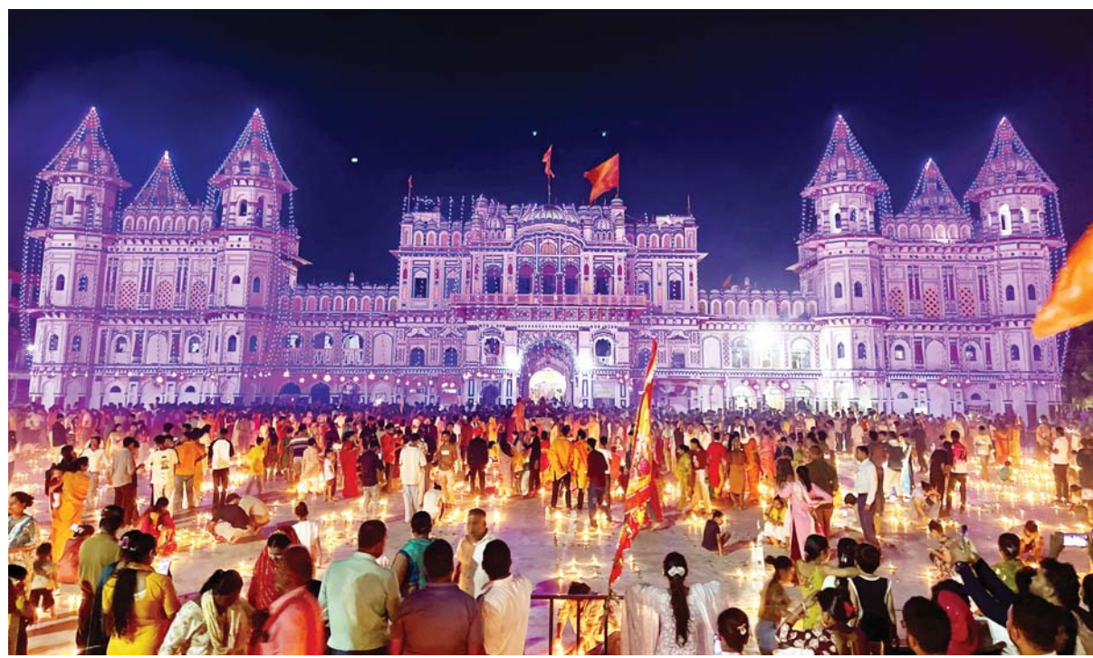
किलिमिली जानकी मन्दिर | जानकी नवमीको अवसरमा शनिवार साँझ जनकपुरधामस्थित जानकी मन्दिर प्रांगणमा सवा लाख दीप प्रज्वलन गर्दै सर्वसाधारण।

हाल वार्षिकरूपमा स्थानीय औलोका विरामीहरू ५० प्रतिशतभन्दा कममा सीमित भएका छन्। यद्यपि, यसलाई शून्यमा भर्ना चुनौती छ। देशभरमा औलोका विरामीको संख्या एक हजार १६४ रहेको छ, जसमा स्थानीय ३९ र आयातीत औलोबाट संक्रमित एक हजार १२४ रहेका छन्। रासस