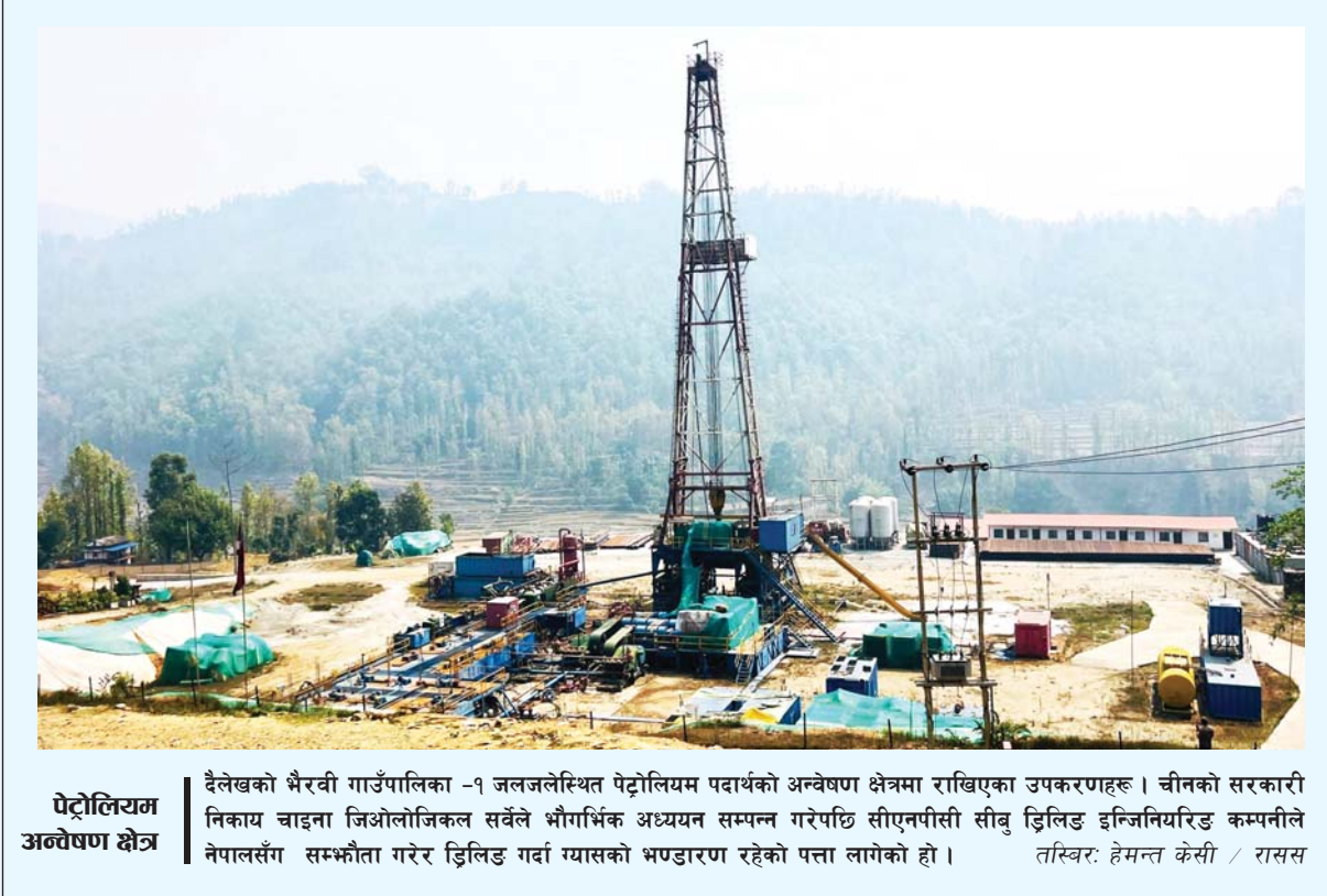
पेट्रोलियम अन्वेषण क्षेत्र दैलेखको भैरवी गाउँपालिका -१ जलजलेस्थित पेट्रोलियम पदार्थको अन्वेषण क्षेत्रमा राखिएका उपकरणहरू। चीनको सरकारी निकाय चाइना जिओलोजिकल सर्वेले भौगर्भिक अध्ययन सम्पन्न गरेपछि सीएनपीसी सीबू ड्रिलिङ इन्जिनियरिङ कम्पनीले नेपालसँग सम्झौता गरेर ड्रिलिङ गर्दा ग्यासको भण्डारण रहेको पत्ता लागेको हो।