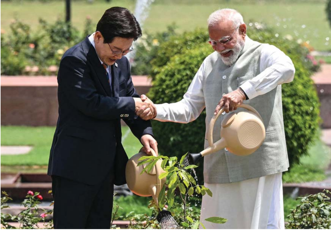
भारतका प्रधानमन्त्री नरेन्द्र मोदी (दायाँ) र दक्षिण कोरियाका राष्ट्रपति ली जे म्युङ (दायाँ) नयाँ दिल्लीस्थित हैदराबाद हाउसमा सोमबार भएको भेटघाटको क्रममा रुख रोप्दै ।