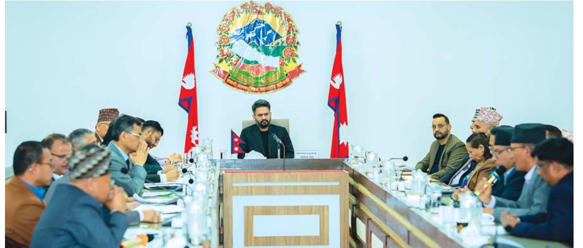
सिंहदरवारस्थित प्रधानमन्त्री कार्यालयमा सोमबार देशभरका विश्वविद्यालयका उपकुलपतिहरूसँगको छलफलमा प्रधानमन्त्री बालेन्द्र शाह।