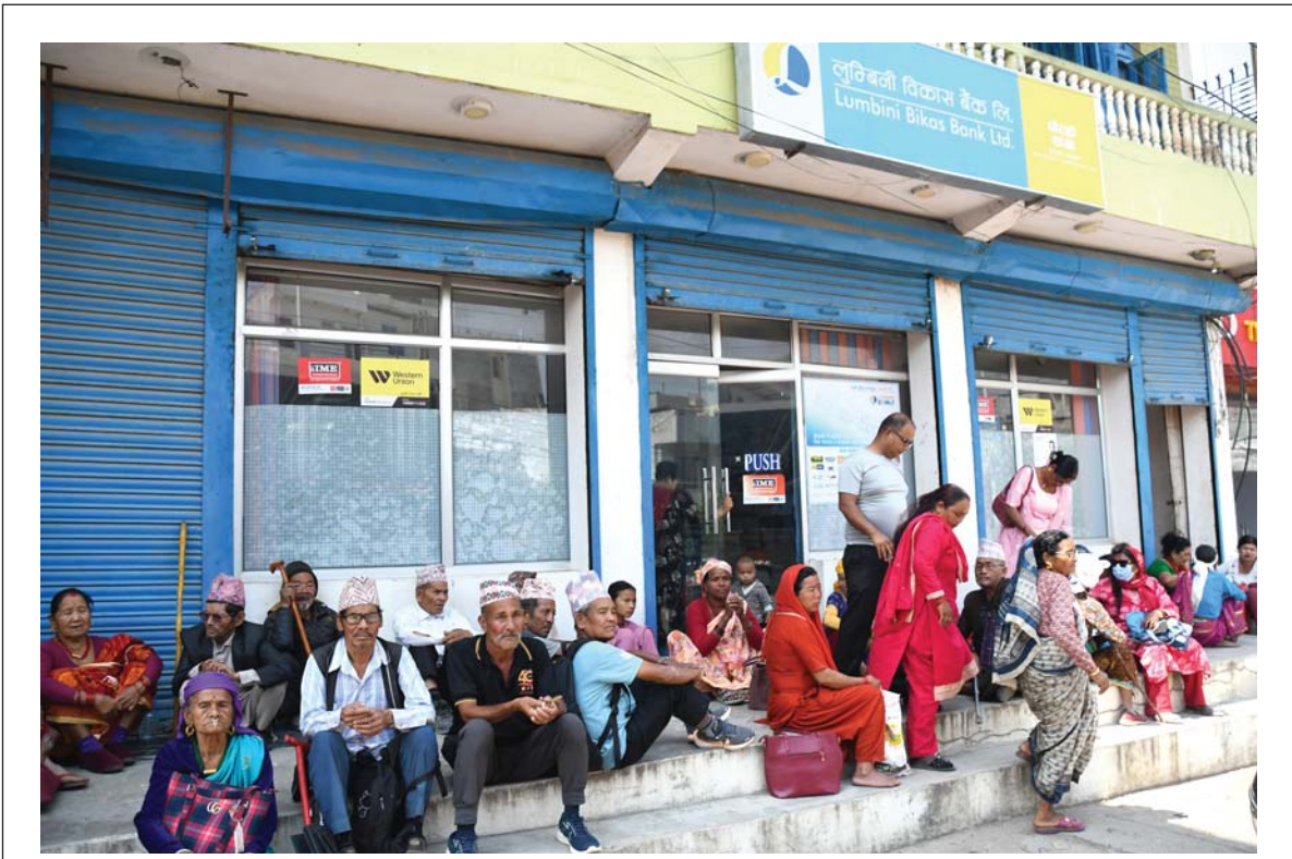
भक्तिको पखाइ | बाडको घोराही उपमहानगरपालिका-१५ स्थित लुम्बिनी विकास बैंक लिमिटेडमा सोमबार सामाजिक सुरक्षा भत्ता लिन पालो कुरेर बसेका घोराही-१ सुकाखोलाबाट आएका सर्वसाधारण ।