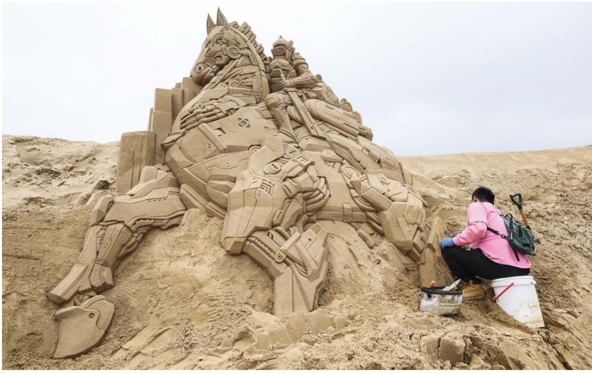
चीनको भोजियाड प्रान्तको फाउण्डेशन सहरको भुजियाजियानस्थित नान्शा रमणीय क्षेत्रमा बालुवाको मूर्तिकलाका काम गर्दै एक कलाकार।