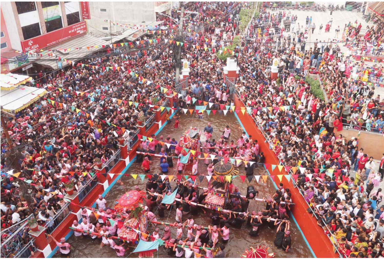
टोखाको बिस्का जात्रा | काठमाडौंको टोखामा विहीवार बिस्का जात्रा मनाउँदै स्थानीय बासिन्दा ।