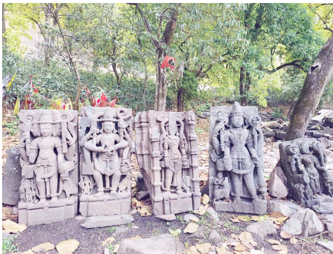
दार्चुलाको उकुमा भेटिएका दार्चुलाको मालिकार्जुन गाउँपालिका-६ स्थित उकु महल उत्खननको क्रममा मन्दिरहरूका भेटिएका मन्दिरका आकृतिहरू विभिन्न आकृतिका मूर्तिहरू।