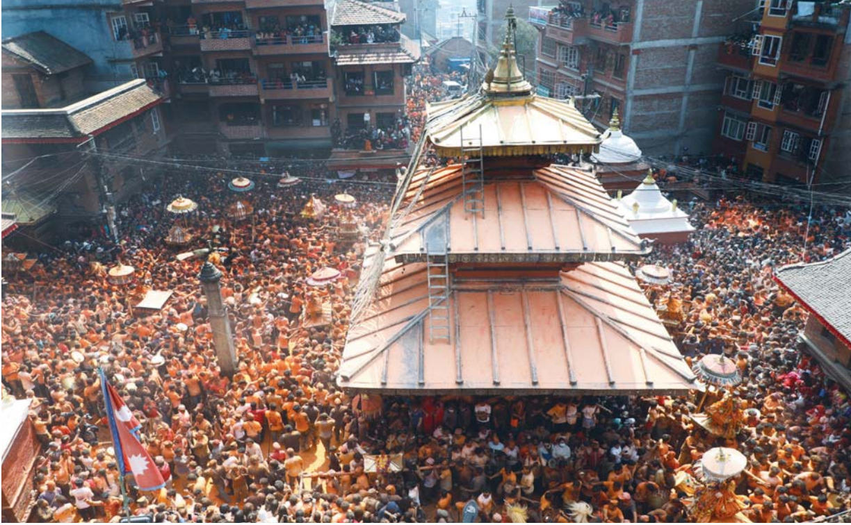
मध्यपुर थिमिमा हरेक वर्ष मनाइने बिस्का: जात्राअन्तर्गत चैत २ गते बुधवार बिहानको जात्रामा बालकुमारी मन्दिर प्रांगणमा बालकुमारी, दक्षिणवाराही, विष्णुवीर, सिद्धिकाली, प्रथम गणेशलगायतको खट जात्रा गरिँदै ।

वर्ष १२ अंक ३४७ काठमाडौं बिहीबार, ३ वैशाख २०८३ Prabhav National Daily Thursday, 16 April 2026 www.prabhavonline.com पृष्ठ ६ मूल्य रु. ५ ।-