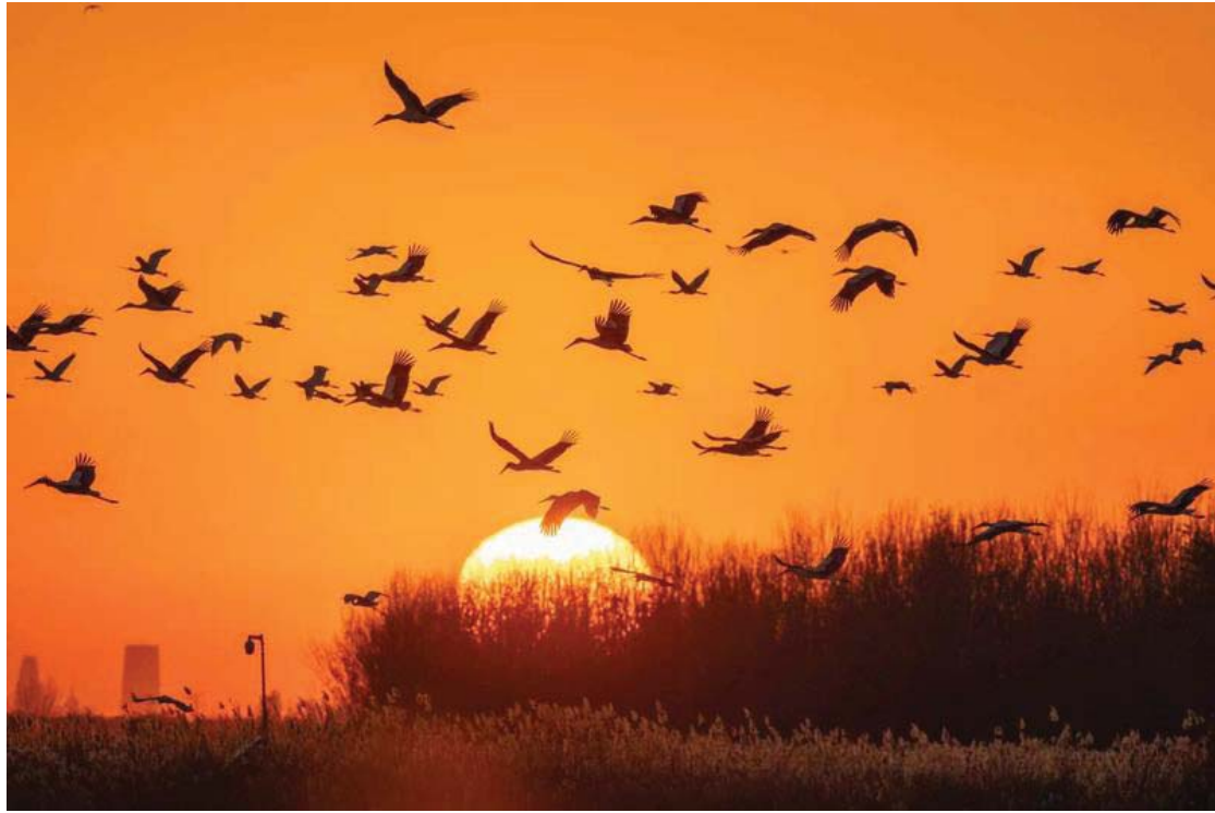
उत्तरी चीनको तियानजिन नगरपालिकाको किलिहाई सिमसारमा प्रवासी चराहरू ।