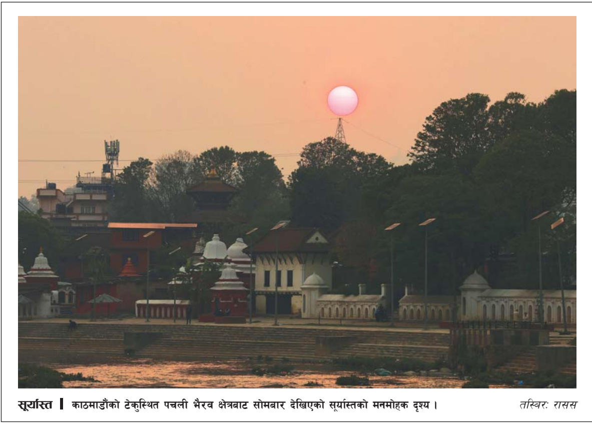
सूर्यास्त | काठमाडौंको टेकुस्थित पचली भैरव क्षेत्रबाट सोमबार देखिएको सूर्यास्तको मनमोहक दृश्य ।

विद्यालयलाई शिक्षा मन्त्रालयको निर्देशन-