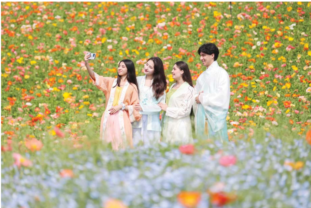
चीनको जियाङ्सु प्रान्तको जुरोडस्थित बैतु सहरमा फूलहरूको बीचमा बसेर सेल्फी खिच्दै विदेशी विद्यार्थीहरू ।