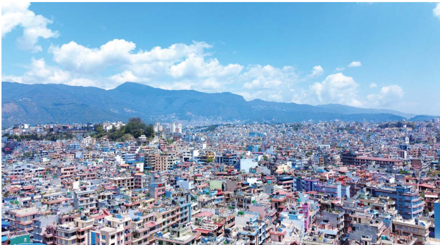
खुला गौसमागा काठमाडौं | शुक्रबार मौसम खुलेसँगै काठमाडौंको तारकेश्वर नगरपालिका-१० मनमैजु क्षेत्रबाट ड्रोन क्यामरामा कैद गरिएको काठमाडौं उपत्यकाको घनाबस्ती।