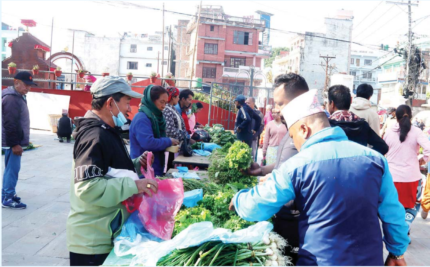
शनिबारे हाटबजार | काठमाडौंको टोबा नगरपालिका-३ स्थित टोबाका शनिवार लाग्ने हाटबजारमा बिक्रीका लागि राखिएको तरकारी खरिद गर्दै उपभोक्ता ।