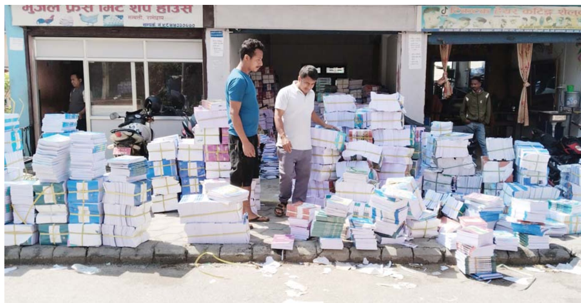
आइपुग्थो | रामेछापको मन्थलीमा रहेको स्टेशनरीमा नयाँ शैक्षिक सत्रका लागि आएको पाठ्यपुस्तक। रामेछापमा शैक्षिक सत्र २०८२ का पाठ्यपुस्तक लागि शैक्षिक सत्र सुरु नहुँदै पाठ्यपुस्तक आइसकेको छ।

'समृद्ध पर्यटकीय बेनी नगर' भन्ने अवधारणाअनुसार बेनीलाई पर्यटकीय, धार्मिक र आध्यात्मिक पर्यटनको केन्द्र बनाउने प्रयास गरिएको नगरप्रमुख केसीले बताए। उनका अनुसार बेनीस्थित कालीगण्डकी र म्याग्दी नदीमा 'सिल्वेन ड्याम' निर्माण गरी 'स्टिमर' सञ्चालनको सम्भाव्यता अध्ययनको चरणमा रहेको छ। रासस