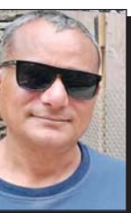
□ ई. कृष्णमत्त दुवाल

आफ्नो अश्वर खाताको विवरण, पासवर्ड, वा ओटिपी कसैलाई पनि नदिने। अपरिचित व्यक्तिलाई तपाईंको अश्वर खाता खोल्न, अपडेट गर्न, वा परिवर्तन गर्न सहयोग नमाग्नुहोस्। कसैले सहयोग गर्नु भने पनि त्यस्तो व्यक्तिको सहयोग नलिने। आफ्नो मोबाइल फोन कसैलाई पनि नदिने। प्रायोजक (स्पान्सर), एचआर कर्मचारी, वा अन्य जो सुकै भए पनि आफ्नो फोनको प्रयोग गर्न अरुलाई नदिने। उनीहरूले तपाईंको जानकारी दुरुपयोग गर्न वा ठगीका लागि प्रयोग गर्न सक्छन्।