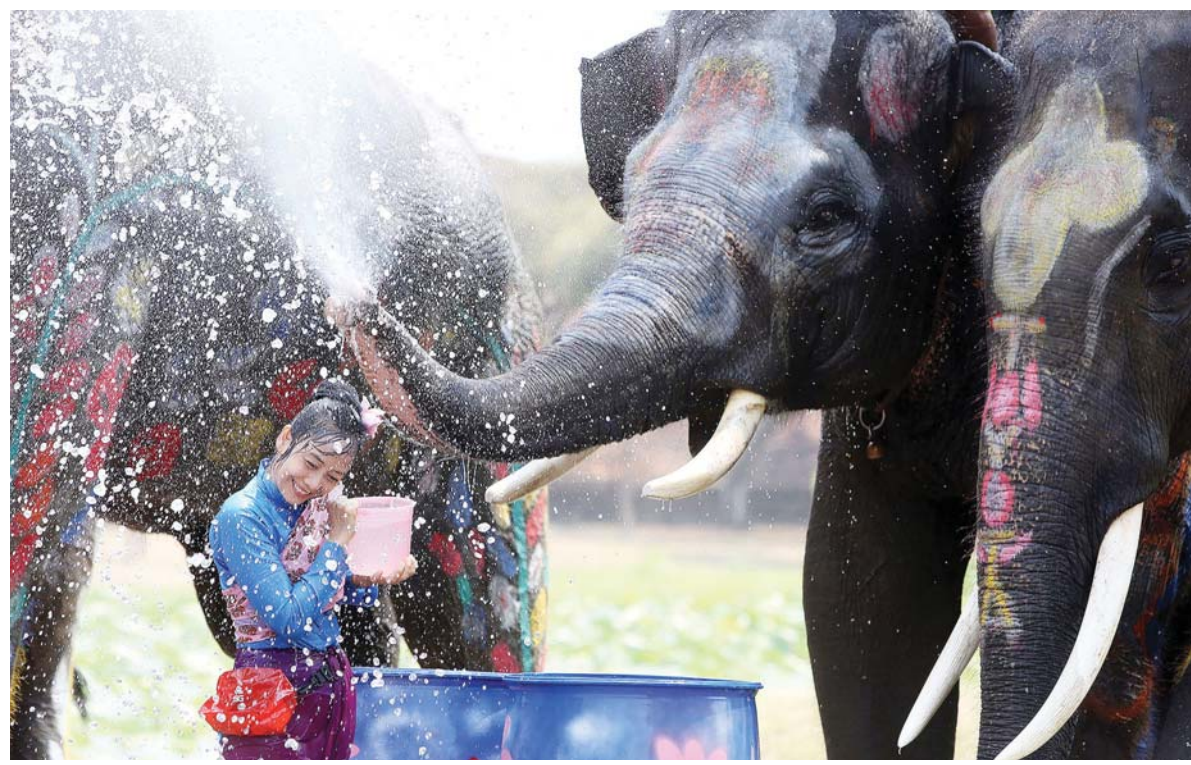
थाइल्याण्डको आयुधयामा सोडक्रान महोत्सवका अवसरमा आयोजित पानी छ्याप्ने कार्यक्रममा हात्तीसँग अन्तरक्रिया गर्दै एक महिला।

समग्रमा, इस्लामाबादमा हुने भनिएको अमेरिका-इरान वार्ता केवल द्विपक्षीय संवादमात्र नभई मध्यपूर्वको व्यापक शक्ति सन्तुलन र युद्धविरामको भविष्यसँग गाँसिएको संवेदनशील कडी बनेको छ। अहिलेको आरोप-प्रत्यारोप र क्षेत्रीय तनावले वार्ताको सफलतामाथि गम्भीर प्रश्न उठाएको छ। रासस/एएफपी