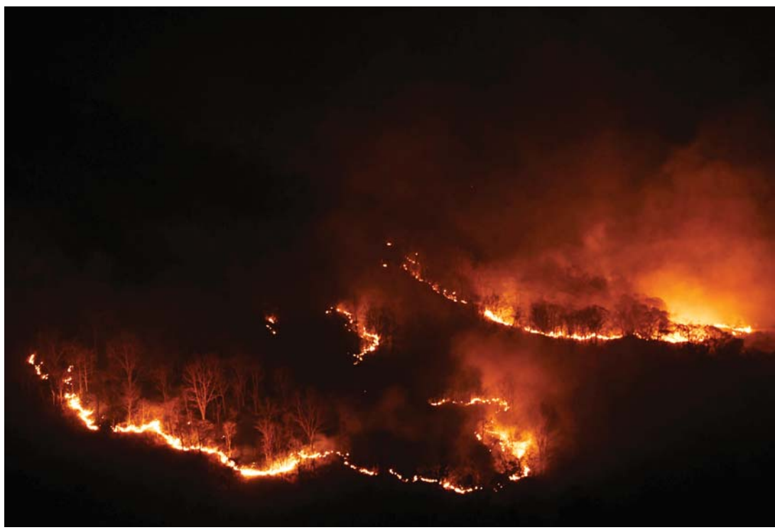
जंगलमा डटेले | बाङ देउखुरीको गढवा गाउँपालिका-८, कोइलाबासस्थित दुर्गा सामुदायिक वन क्षेत्रमा मंगलबार राति लागेको उदेलो । तिरिस्वर: रासस