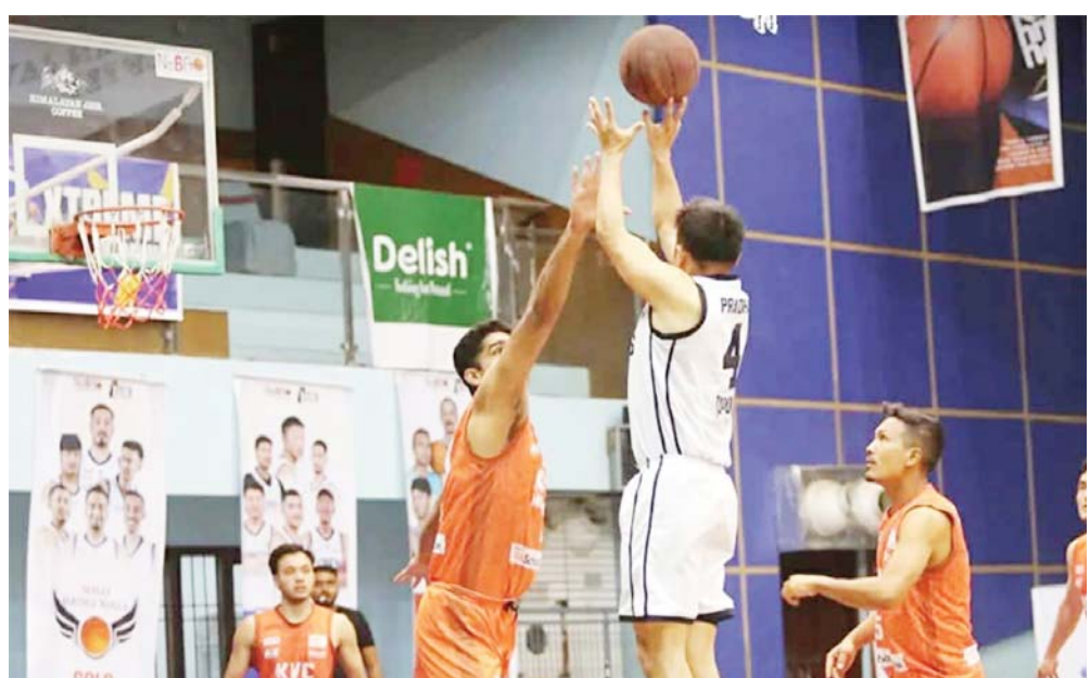
लिग चरणमा टाइम्स तेस्रो र हाउण्ड्स चौथो भएको थियो। लिग चरणमा दुवैले एक आपसमा दुई खेल खेल्दा एक-एक खेल जितेका थिए।

काठमाडौं- हिमालयन जाभा नेशनल बास्केटबल लिग (एचजेनएबीएल) २०२६ अन्तर्गत मंगलबार भएको एलिमिनेटरमा टाइम्स बास्केटबल क्लबले केभीसी हाउण्ड्सलाई पराजित गर्दै दोस्रो क्वालिफायरमा स्थान बनाएको छ।