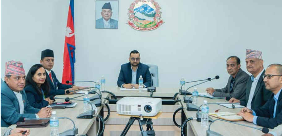
संविधान संशोधनको बहसपत्र तयार गर्न गठित कार्यदलको बुधवार प्रधानमन्त्री तथा मन्त्रिपरिषद् कार्यालयमा बसेको बैठक ।