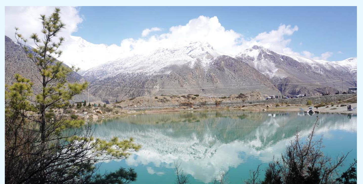
हिमालको छायो | मुस्ताङको घरभन्डोड गाउँपालिका-५ स्थित समुन्द्री सतहको दुई हजार ८३० मिटरको उचाईमा अवस्थित प्राकृतिक ढुम्बाताल र तालमा देखिएको निलगिरि हिमालको चित्र ।