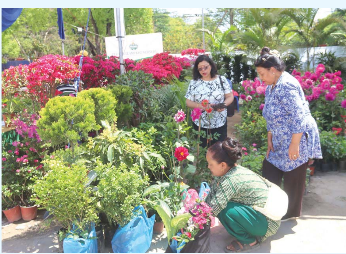
एवरोपोमा नर्सरी व्यवसायी संघ नेपालले काठमाडौंको भूकूटीमण्डपमा चैत १९ देखि २३ गतेसम्म आयोजना गरेको तेस्रो 'नेसनल आगवृत्तक हर्टिकल्चर एक्सपो'मा विभिन्न फूलका विरुवा किन्नका लागि आएका सर्वसाधारण।