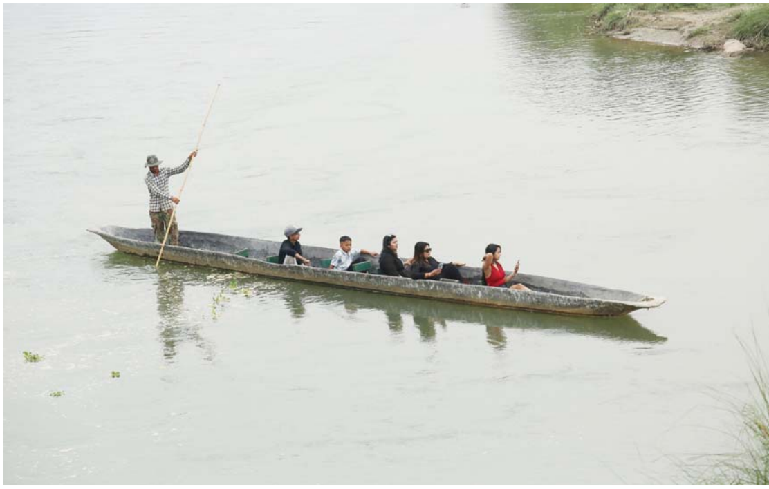
डुंगा सयर । चितवनको सौराहस्थित राप्ती नदीमा डुंगा सयर गर्दै आन्तरिक पर्यटक ।