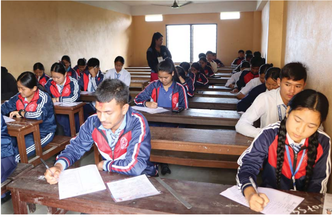
एसडी परीक्षा | संखुवासभाको खाँदवारी नगरपालिका-१ स्थित हिमालय माध्यमिक विद्यालय परीक्षा केन्द्रमा माध्यमिक शिक्षा परीक्षा दिादै विद्यार्थी (एसडी) परीक्षा दिँदै विद्यार्थी ।