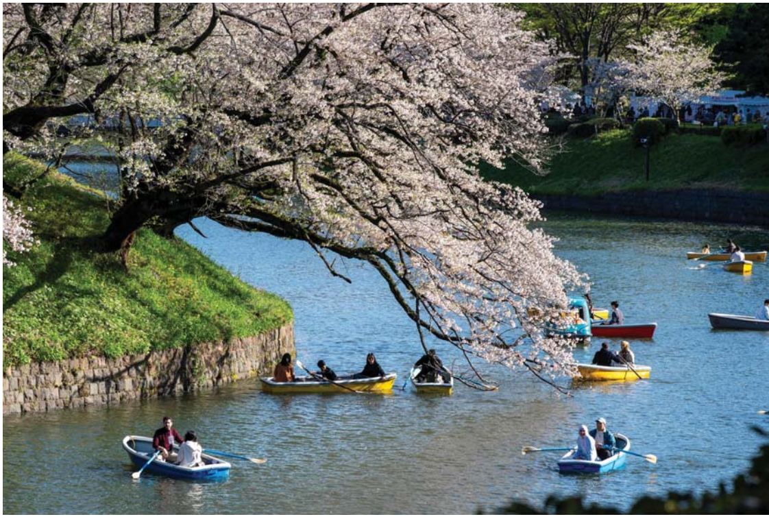
जापानको टोकियोस्थित इम्पेरियल दरवार वरिपरिको खाडलहरूमध्ये एक चिदोरिगाफुचीमा फुलेको चेरीको फूल अवलोकन गर्न डंगामा सवार मानिसहरू।