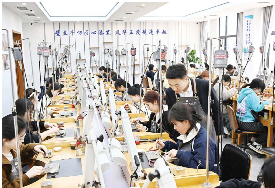
पूर्वी चीनको शानडोङ प्रान्तको छिडदाओमा रहेको छिडदाओ प्रिस्कूल शिक्षा कलेजको कक्षामा गहना प्रशोधन सीपको अभ्यास गर्दै विद्यार्थी।