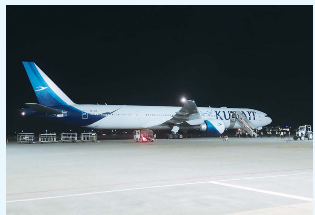
उडान उडान मध्यपूर्वमा जारी युद्धमा प्रभावित नेपालीहरूलाई लिएर बुधवार रूपन्देहीको भैरहवास्थित गौतमबुद्ध अन्तर्राष्ट्रिय विमानस्थलमा अवतरण गरेको कुवेत एयरको विमान।