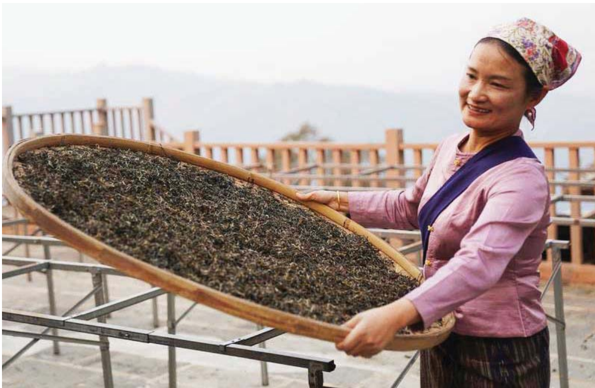
दक्षिणपश्चिम चीनको युनान प्रान्तको पुअर सहरको लानकाउ काउन्टीको जिगमाई गाउँमा सुकेको चियापात संकलन गर्दै एक किसान ।