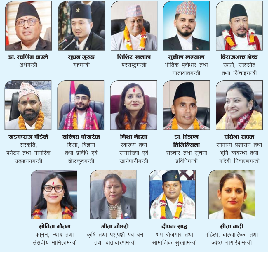
डा. स्वर्णिम वाग्ले अर्थमन्त्री सुधन गुरुङ गृहमन्त्री शिबिर खनाल परराष्ट्रमन्त्री सुनिल लम्साल भौतिक पूर्वाधार तथा यातायातमन्त्री विराजभक्त श्रेष्ठ ऊर्जा, जलस्रोत तथा सिंचाइमन्त्री खड्कराज पौडेल पर्यटन तथा नागरिक उड्डयनमन्त्री सस्मित पोखरेल संस्कृति, पर्यटन तथा नागरिक उड्डयनमन्त्री बिशा मेहता स्वास्थ्य तथा जनसंख्या एवं खानेपानीमन्त्री डा. विक्रम तिमिल्सिना सञ्चार तथा सूचना प्रविधिमन्त्री प्रतिभा रावल सामान्य प्रशासन तथा भूमि व्यवस्था तथा गरिवी निवारणमन्त्री सोविता गौतम कानून, न्याय तथा संसदीय मामिलामन्त्री गीता चौधरी कृषि तथा पशुपक्षी एवं वन तथा वातावरणमन्त्री दीपक साह श्रम रोजगार तथा सामाजिक सुरक्षामन्त्री सीता बादी महिला, बालबालिका तथा ज्येष्ठ नागरिकमन्त्री