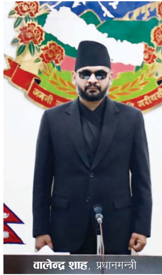
बालेन्द्र शाह, प्रधानमन्त्री

तथा सूचना प्रविधिमन्त्रीमा डा. विक्रम तिमिल्सिना, सामान्य प्रशासन तथा भूमि व्यवस्था तथा गरिवी निवारणमन्त्री प्रतिभा रावल, कानून, न्याय तथा संसदीय मामिलामन्त्री सोविता गौतम बने । कृषि तथा पशुपक्षी एवं वन तथा वातावरणमन्त्री गीता चौधरी, श्रम रोजगार तथा सामाजिक सुरक्षामन्त्री दीपक साह र महिला, बालबालिका तथा ज्येष्ठ नागरिकमन्त्री सीता बादी बनेका छन् । नवनिर्वाचित मन्त्रीहरूले शुक्रबार नै राष्ट्रपति पौडेलबाट पद तथा गोपनीयताको शपथ लिएका छन् । रक्षा र उद्योग, वाणिज्य तथा आपूर्ति मन्त्रालयको जिम्मेवारी भने हाल प्रधानमन्त्री शाहले आफैँ सम्हालेका छन् ।