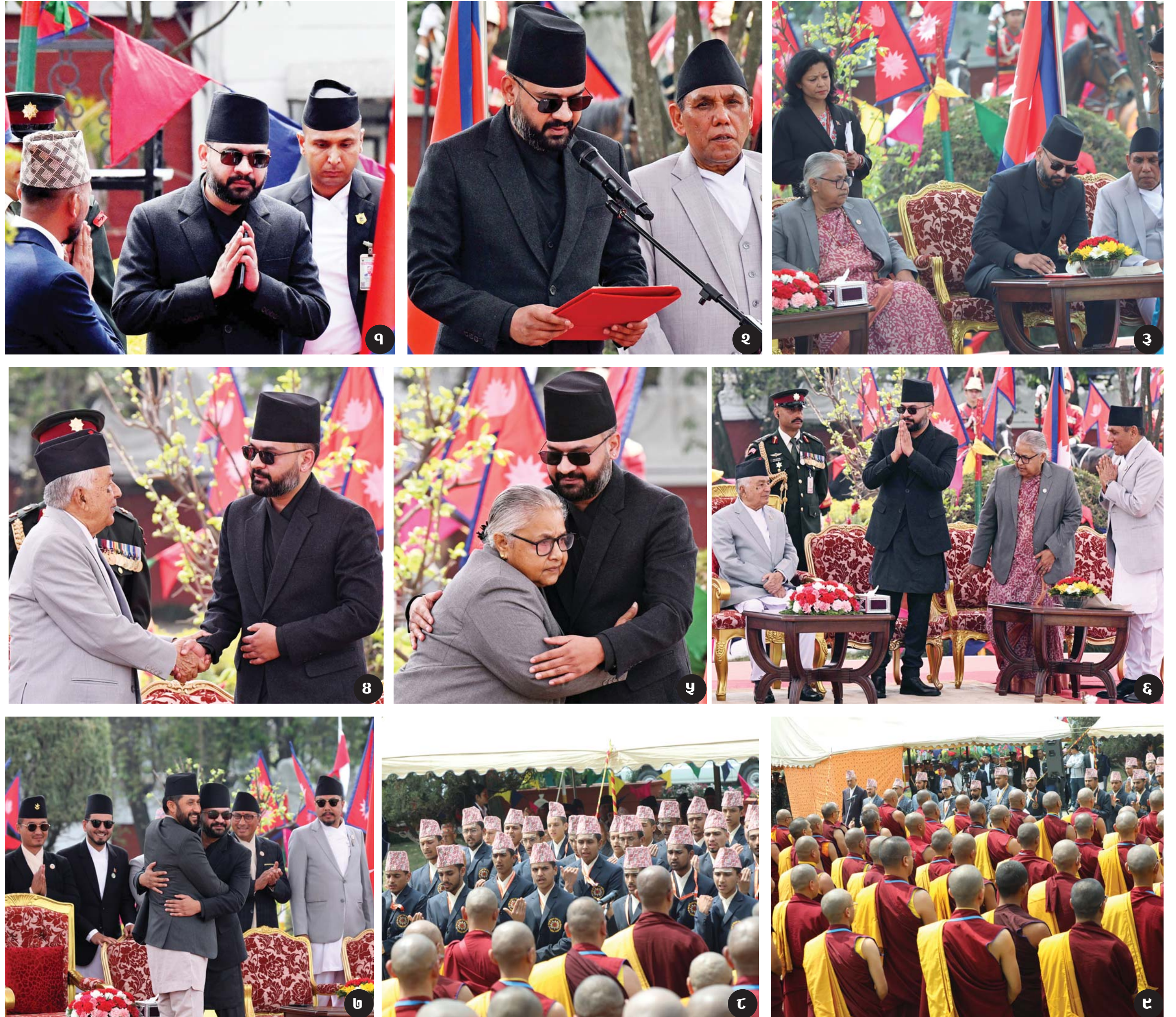
१) नवनि्युक्त प्रधानमन्त्री वालेन्द्र शाह शुक्रबार राष्ट्रपति निवास शीतलनिवासमा आयोजित शपथ ग्रहण समारोहमा सहभागी हुने क्रममा । २) राष्ट्रपति रामचन्द्र पौडेलबाट पद तथा गोपनीयताको शपथ लिँदै नवनि्युक्त प्रधानमन्त्री शाह । ३) पद तथा गोपनीयताको शपथपछि हस्ताक्षर गर्दै प्रधानमन्त्री शाह । ४) नवनि्युक्त प्रधानमन्त्री शाहलाई बधाई दिँदै राष्ट्रपति रामचन्द्र पौडेल । ५) नवनि्युक्त प्रधानमन्त्री शाहलाई पद हस्तान्तरण गर्नेक्रममा बधाई दिँदै निवर्तमान प्रधानमन्त्री सुशीला कार्की । ६) नवनि्युक्त प्रधानमन्त्री शाह र निवर्तमान प्रधानमन्त्री कार्कीको सिट साटासाट गरिँदै । ७) नवनि्युक्त प्रधानमन्त्री शाहलाई बधाई ज्ञापन गर्दै राष्ट्रिय स्वतन्त्र पार्टीका सभापति रवि लामिछाने । ८) नवनि्युक्त प्रधानमन्त्री शाहले शपथ ग्रहण गर्नुअघि स्वस्ती मन्त्र वाचन गर्दै बटुकहरू । ९) शपथ ग्रहणअघि अष्टमंगल पाठ गर्दै बौद्ध लामागुरुहरू ।