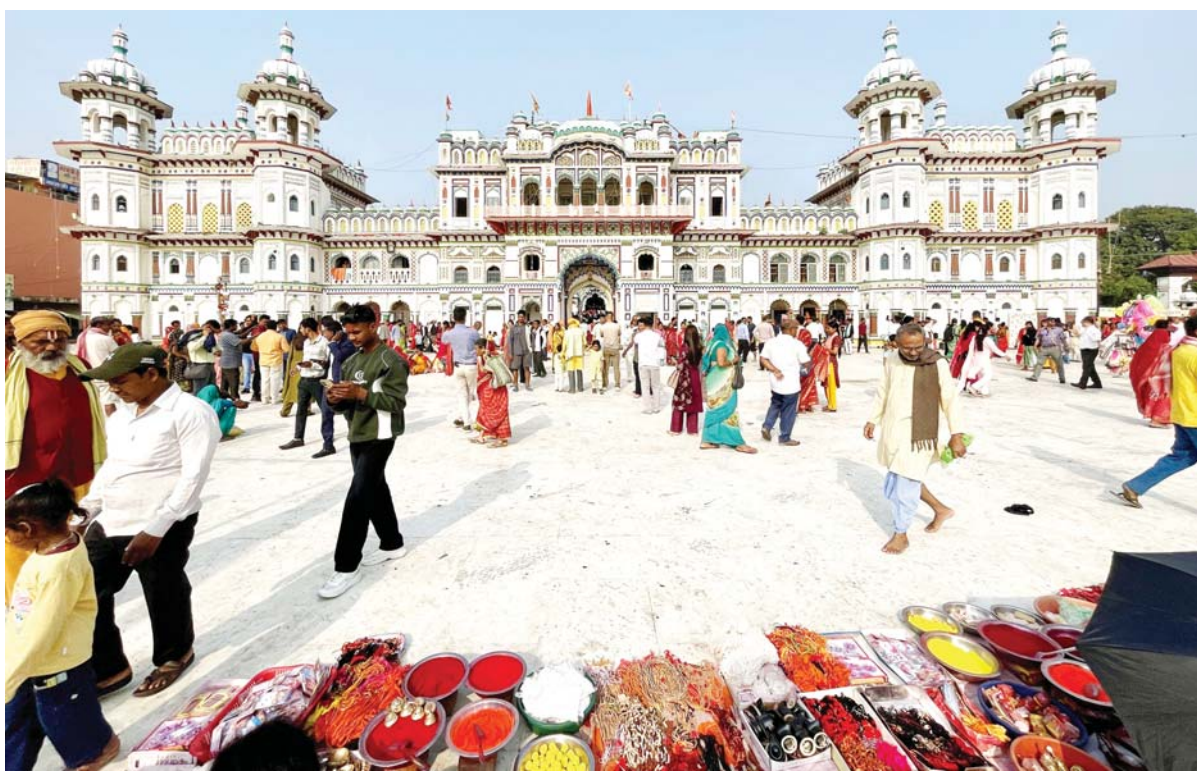
जानकी मन्दिरमा मत्तजन

रामनवमीको अवसरमा शुक्रबार जानकी मन्दिरमा पूजाअर्चना गर्न आएका भक्तजन ।