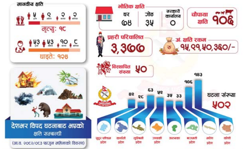
स्रोत: विपद् विवरणमा आउलागी बाढी पहिरो, चट्याक, जलावर आक्रमण, जलानारी, हावाहुरी, हिमपात, हिमपहिरो, शीतलहर, अतिरल वर्षा, दुर्घटना, लेक लाग्ने घटना, भूकम्प, सर्पिटा र अन्य घटनाहरूबाट भएको क्षतिको जम्मा संख्या देखाइएको छ।

भौतिक पूर्वाधारतर्फको क्षतिलाई हेर्दा फागुन महिनामा ७४ वटा घर र ३५ वटा गोठमा क्षति पुगेको जनाइएको छ। पशुधनतर्फ कूल १०६ वटा चौपायाको क्षति भएको छ। यी सबै विपद्जन्य घटनाहरूबाट भएको कूल आर्थिक क्षतिको मूल्यांकन १५ करोड ९१ लाख ५० हजार रूपैयाँ गरिएको