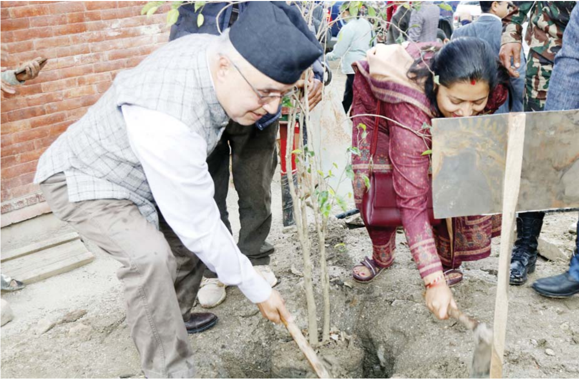
अर्थमन्त्री रामेश्वर खनाल शुक्रवार सिंहदरवारस्थित संघीय संसद् भवनअगाडि वन तथा वातावरण मन्त्रालय र वन तथा भू-संरक्षण विभागले आयोजना गरेको वृक्षरोपण कार्यक्रममा बिस्वा रोप्ये ।