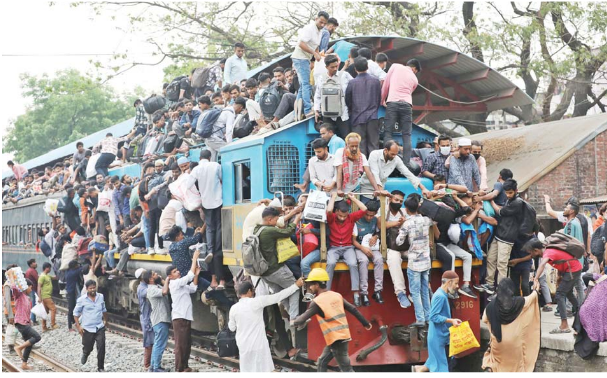
बंगलादेशको गाजीपुरको टोंगी रेलवे स्टेशनमा घर फर्कने रेल चढ्दै मानिसहरू। इद अल-फित्र नजिकिँदै गदां यहाँको स्टेशन घर फर्कने यात्रुहरूको ठूलो संख्याले भरिएको छ।