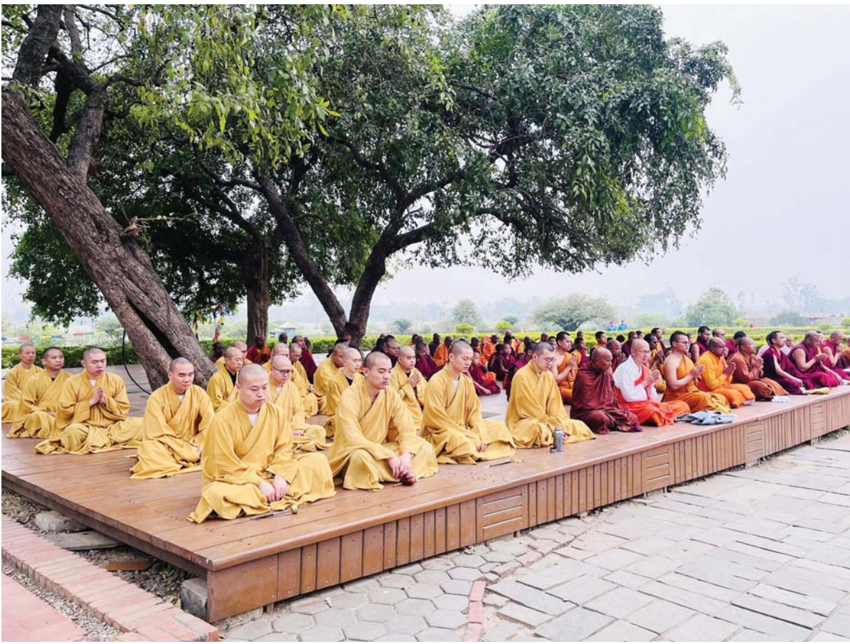
लुम्बिनीमा शुक्रबार आयोजित 'तेस्रो लुम्बिनी अन्तर्राष्ट्रिय शान्ति महोत्सवको उद्घाटन समारोह तथा अन्तर्राष्ट्रिय ध्यान दिवस' कार्यक्रममा ध्यान गर्दै भिक्षुहरू ।