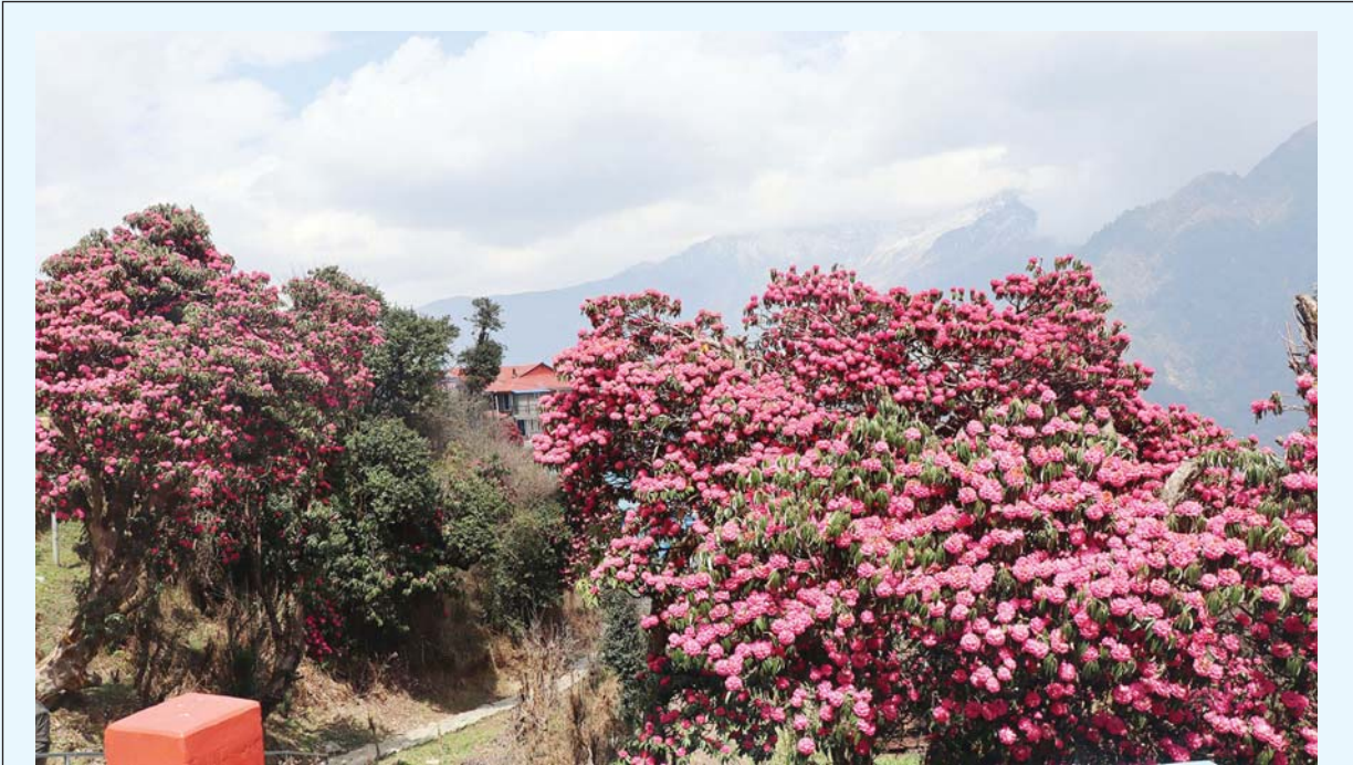
ढकमकक फुलेको लालीगुराँस | म्याग्दीको अन्नपूर्ण गाउँपालिका-६ स्थित घोडेपानीमा ढकमकक फुलेको लालीगुराँस। वसन्त याममा घोडेपानीको पाखाभा लालीगुराँस फुलेको लालीगुराँसले पर्यटकलाई आकर्षित गरेको छ।